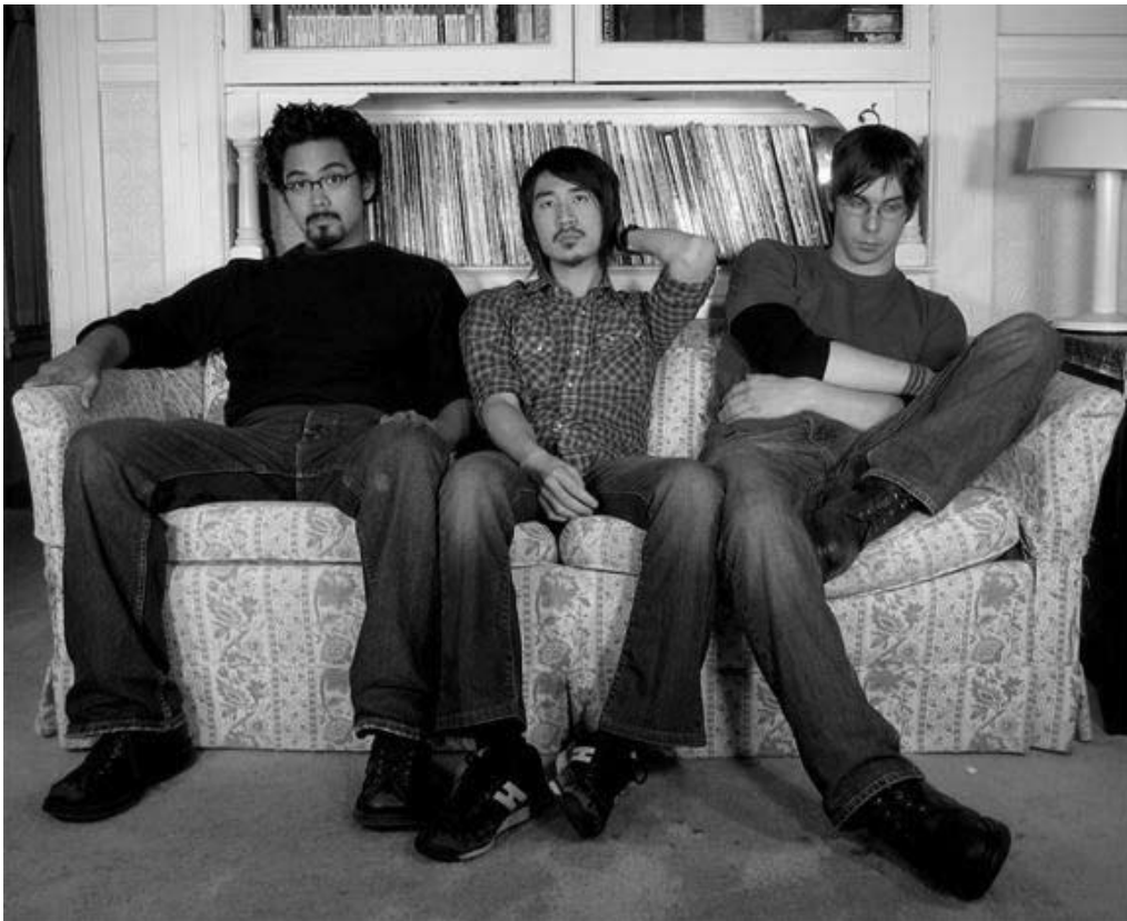
Trois révolutionnaires, sans mots ...