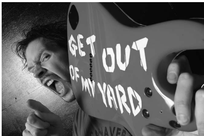
Hier können sich nicht nur Luftgitarrenhelden inspirieren: Der Gitarrenvirtuose Paul Gilbert tritt am 11. November mit seiner Band im hauptstädtischen Atelier auf.

Tout noir, tout blanc , atelier pour enfants de 6 à 12 ans, Musée national d'histoire et d'art, Luxembourg, 14h30. Tél. 47 93 30-214.