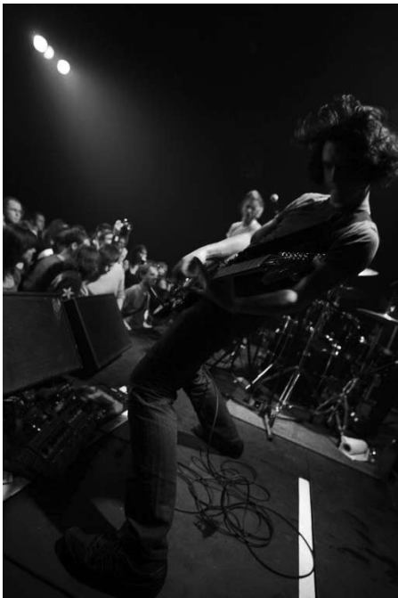
L'énergie à l'état brut : These Arms Are Snakes