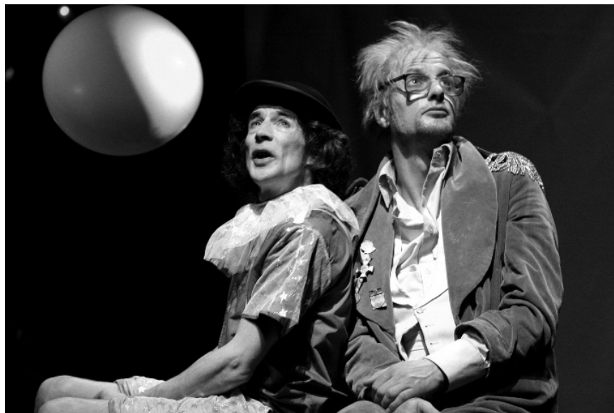
Mit dem Stück „Am Anfang“ erzählt „Das Theater an der Parkaue“ am 15. und 17. März mit Objekten und Musik vom Ursprung der Welt. Für alle ab sechs.

Festival des Migrations, des Cultures et de la Citoyenneté et Salon du livre , stands d'information, musique, danses, rencontres avec auteur-e-s,