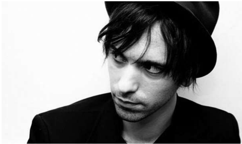
Casador : un des artistes que Panoplie nous fera découvrir ce vendredi soir.