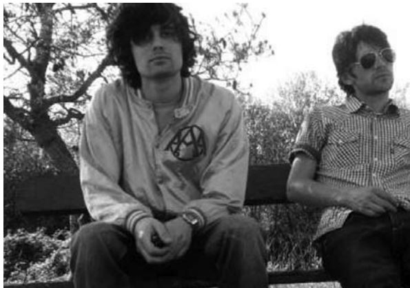
Sont plutôt relaxés et relaxants : 6 P.M.