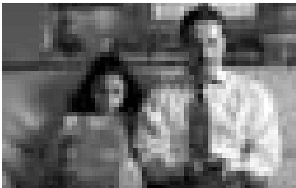
Difficile de grandir avec un père pareil.