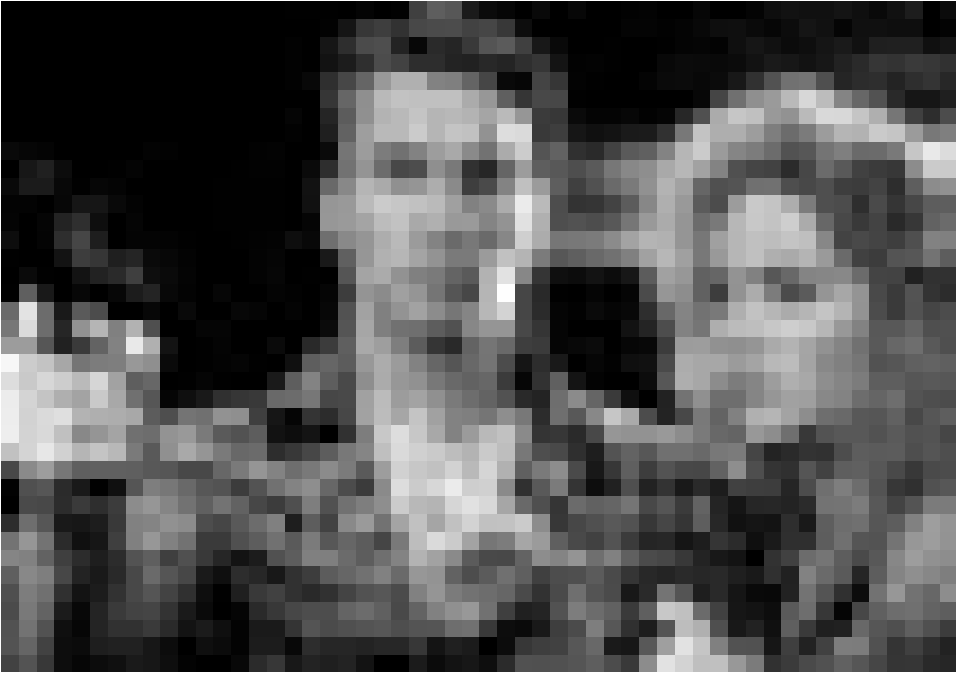
Ce vendredi Open Air Cinema : Arnold Schwarzenegger et Sharon Stone dans « Total Recall »

Pour échapper aux gangsters qui les pourchassent, deux jazzmen se