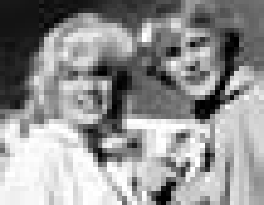
Ce samedi Open Air Cinema : Marilyn Monroe et Jack Lemmon dans « Some Like it Hot »

Ada, jeune femme muette, débarque avec sa petite fille en Nouvelle-Zélande pour se marier avec un parfait inconnu. Hélas, son futur mari, venu chercher femme et bagages sur la plage, refuse de transporter le piano d'Ada. Mais cet instrument est sa voix.