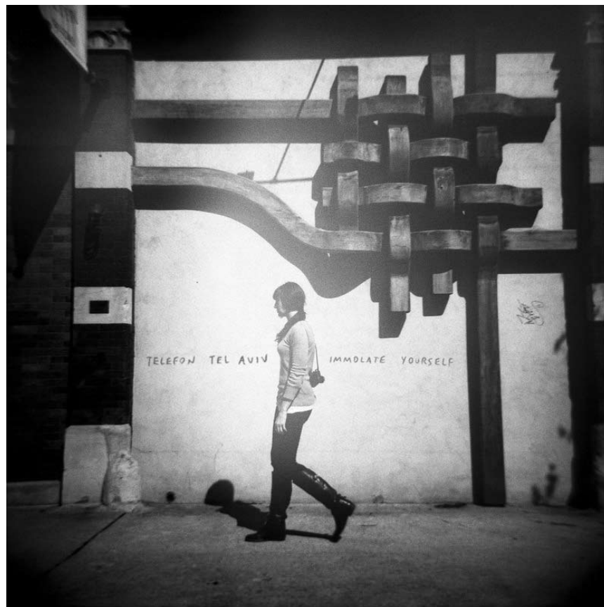
Telefon Tel Aviv gastieren an diesem Freitag, dem 12. Juni mit ihrem tanzbaren Laptop-Folk im Exit07.