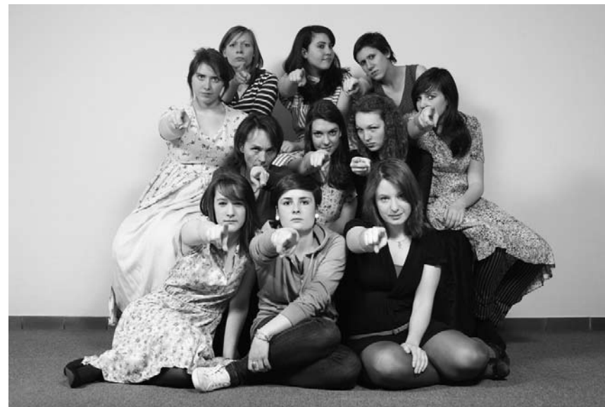
Die deutschsprachige Schauspielklasse aus dem Musikkonservatoriums macht am 18. Juni auf der Bühne des Studios im Grand-Théâtre erste Erfahrungen vor Publikum.

Les Chantiers de l'Escabelle , présentation du travail des ateliers de Florange, de l'IME et du CAT de Briey et du club de prévention d'Uckange, et présentation du travail de l'atelier adulte de Florange (20h), Centre culturel « La Passerelle », Florange , 14h. Tél. 0033 3 82 59 17 99.