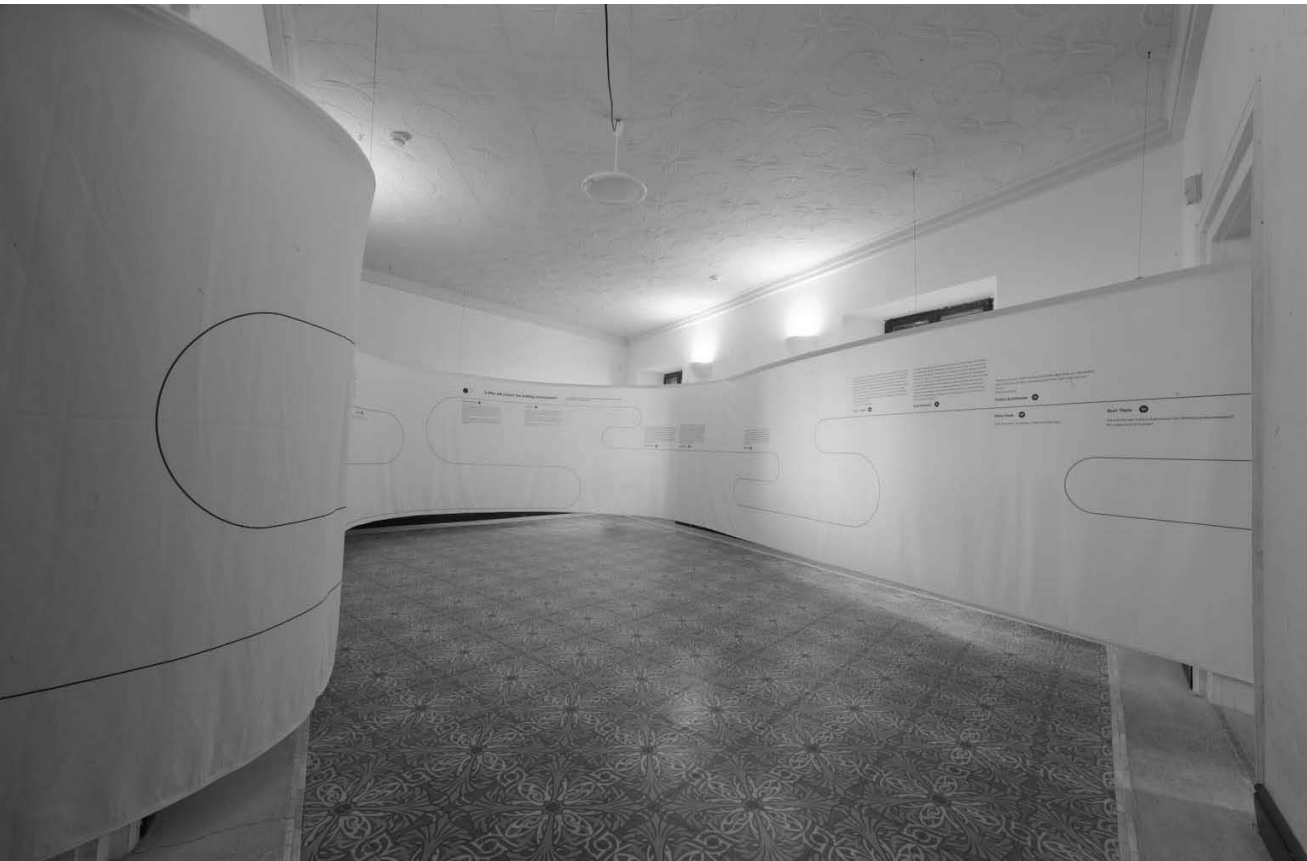
L'exposition « Points of view. 4 Questions. 44 Answers. » présente à la Fondation de l'Architecture et de l'Ingénierie la participation nationale du grand-duché de Luxembourg à la 11e Biennale d'Architecture à Venise.

„Dass die ausgestellten Werke Kunst sein sollen, kann man noch nachvollziehen, es steckt aber keine große Kunst dahinter, all diese Werke