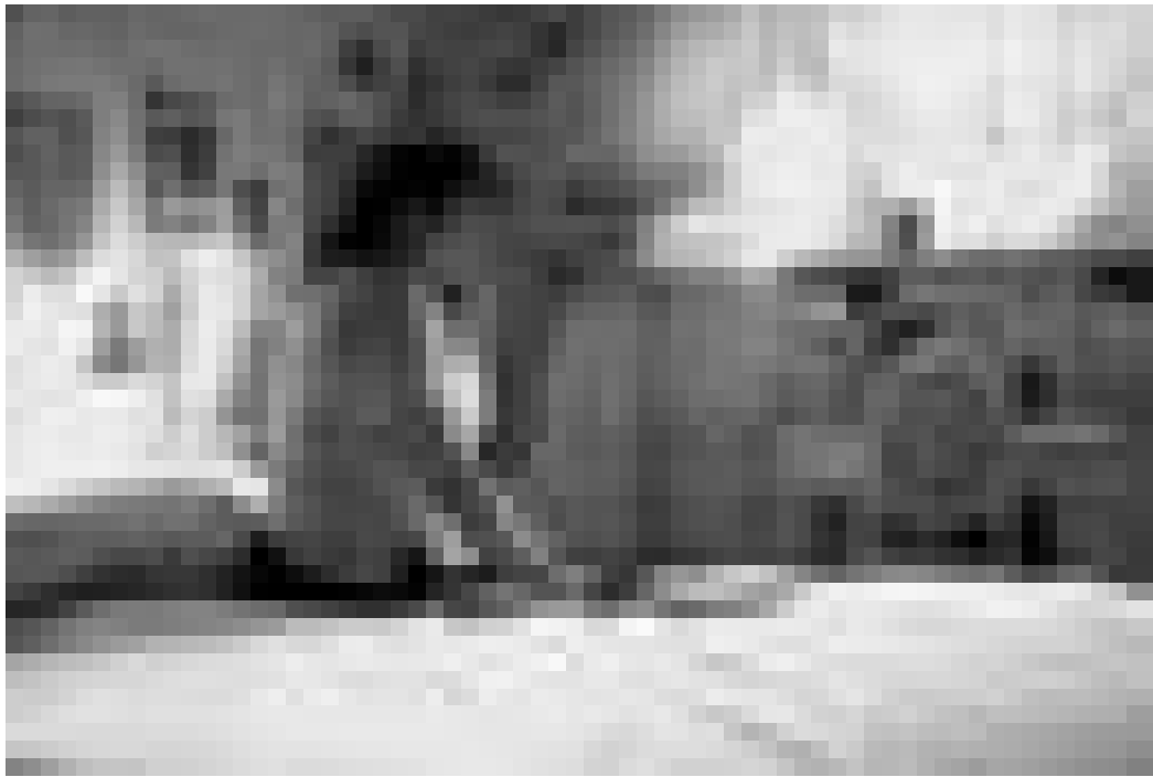
Difficile de vivre avec le mal du pays...