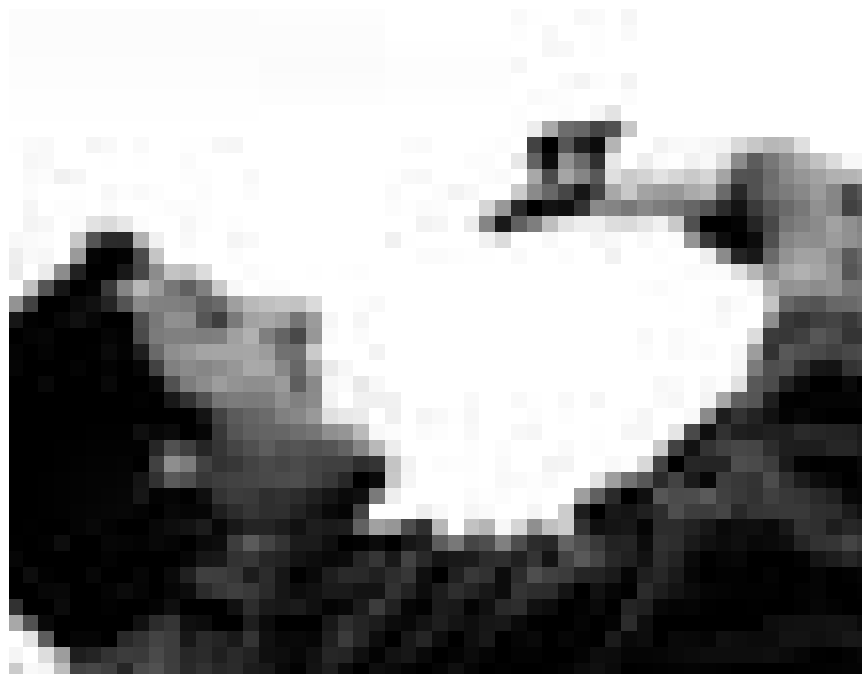
Freiheit kann vieles sein : Zum Beispiel einen Schwan erwürgen ... Faris Faris in: „Ein Augenblick Freiheit“, neu im Utopia.