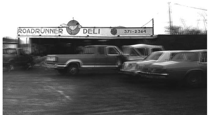
Memorial Drive de Carine et Elisabeth Krecké est un roadtrip fictif à travers le Texas contemporain, réalisé à partir de trois types d'images. Jusqu'au 7 novembre à la Galerie d'Art contemporain Nosbaum et Reding.