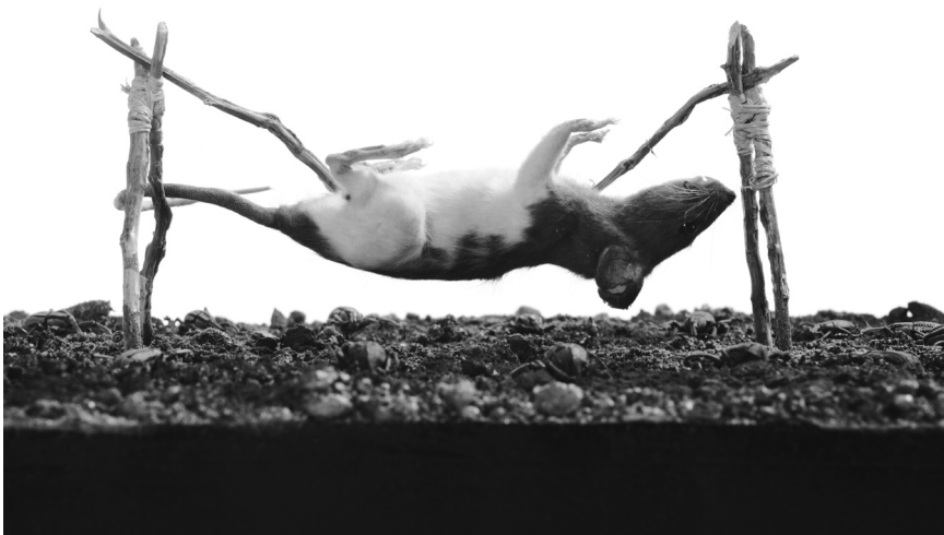
N'y va pas par quatre chemins : les « Thinking Models » de Jan Fabre, à la Galerie Beaumontpublic+Königsbloc pourraient choquer le bourgeois.

art religieux, croyances populaires, légende ardennais, Musée en Piconrue (24, place St-Pierre, tél. 0032 61 21 56 14), jusqu'au 3.1.2010, ma. - di. 10h - 18h.