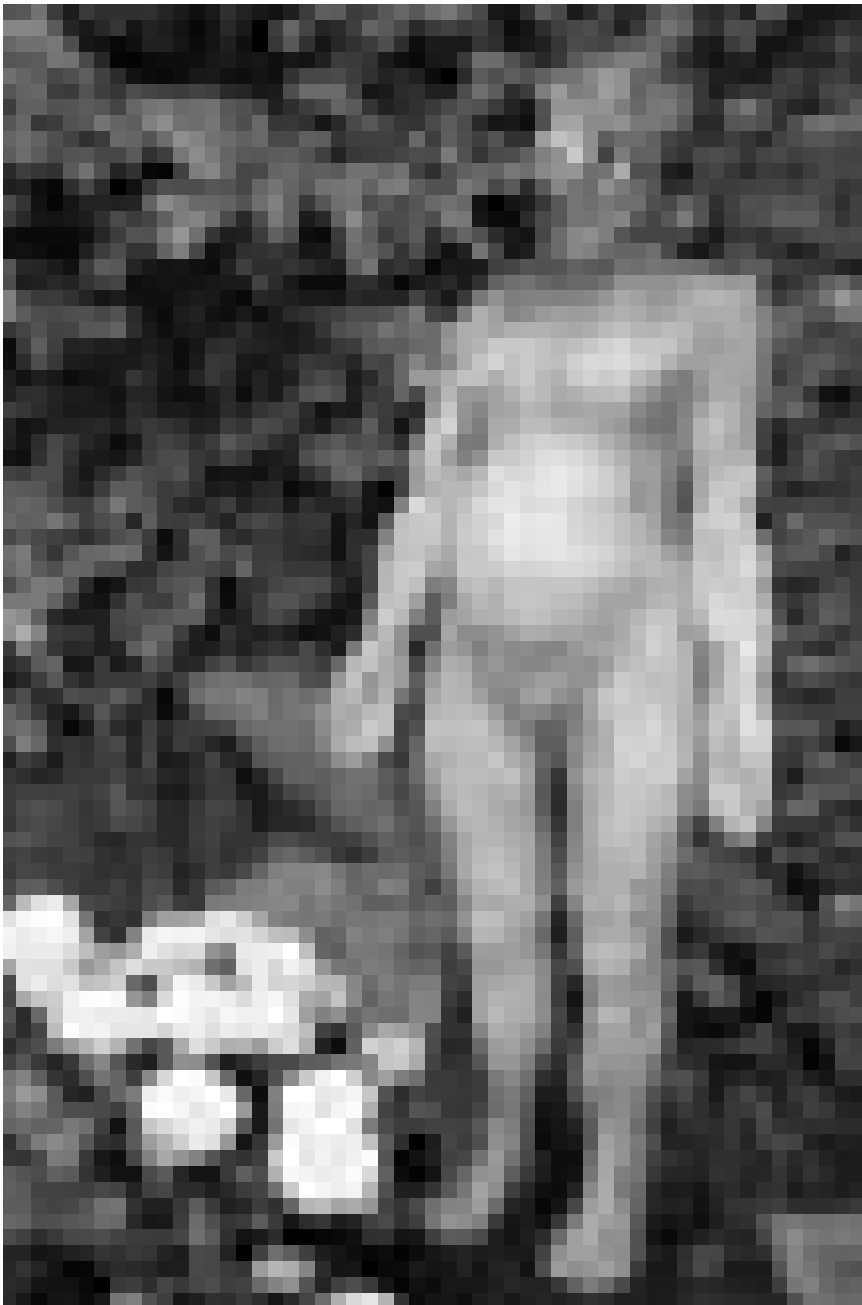
Elle peut être étrange, « La vie sur terre ». Exposition collective à la maison de la culture d'Arlon, jusqu'au 28 mars.