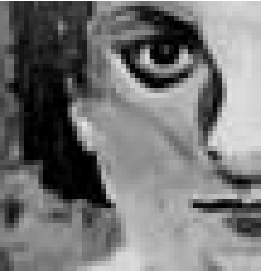
„Frau im Bild“: Keine Klatschzeitung sondern eine Ausstellung von Ilona Gommès. Bis zum 31. März im Mierscher Kulturhaus.

NEW Raum-Video-Sound-Projection, Studioblau, Saarländisches Künstlerhaus (Karlstraße 1,