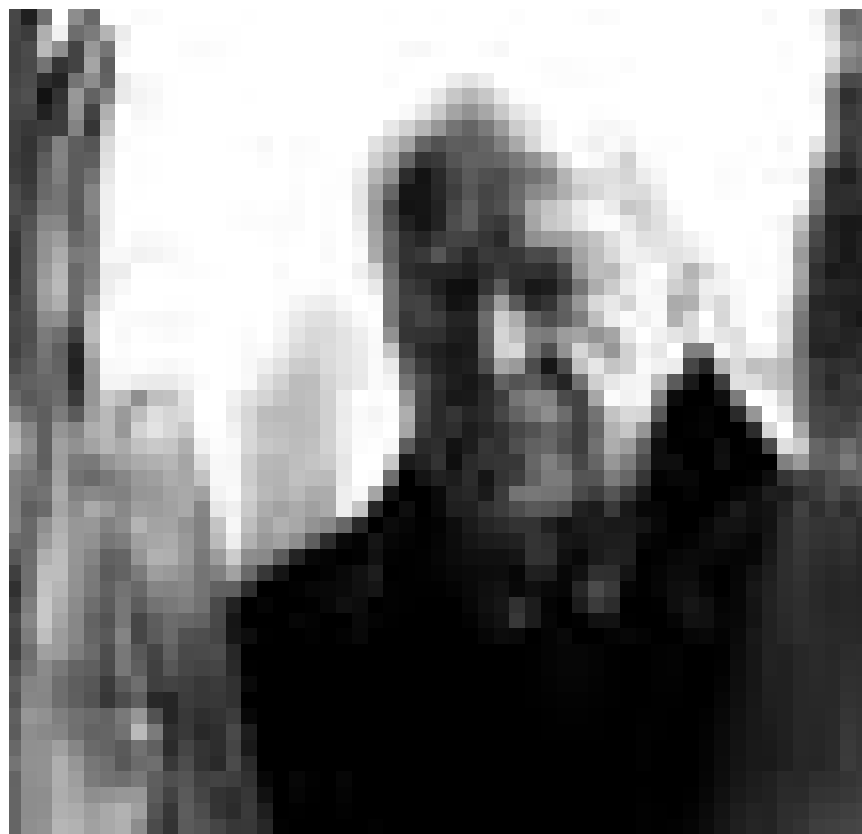
Reprend du service : Michael Caine dans « Harry Brown ». Samedi au CinéBelval. Dans le cadre du festival « Films from the Isles ».

Der junge Schotte Renton ist Junkie und arbeitslos. Mit seinen Freunden Sick Boy, Spud und Begbie ist er ständig auf der Jagd nach dem nächsten Schuss. Eine Überdosis Heroin bringt ihn aber dazu, den Entzug zu wagen. Er schafft es schließlich, aber nicht ohne einige Rückfälle mit schreckli-