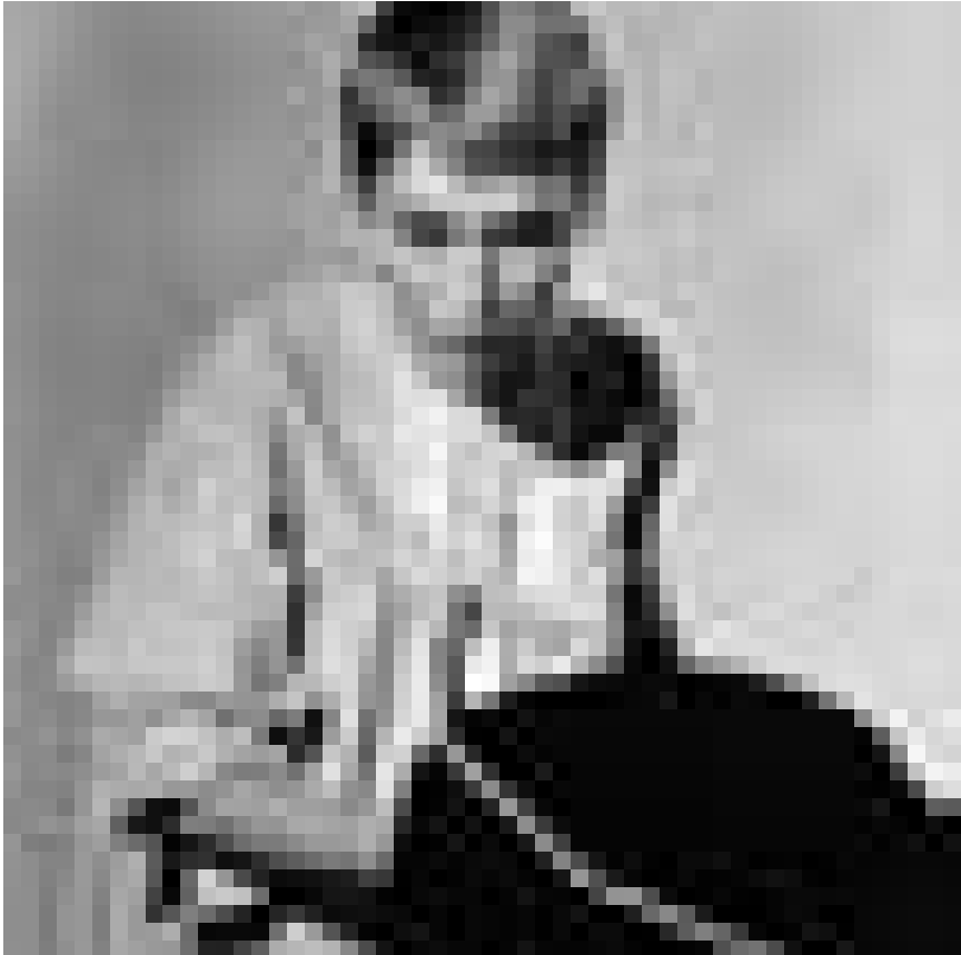
Il doit avoir un rire plutôt satanique, ce petit... Mia Farrow dans « Rosemary's Baby », samedi à la Cinémathèque.

Deux jeunes femmes, l'une attachée d'administration, l'autre informati- cienne, se lient d'amitié. Pendant les vacances, leurs sentiments amoureux vont compliquer leurs relations. (Cycle des Comédies et proverbes : VI)