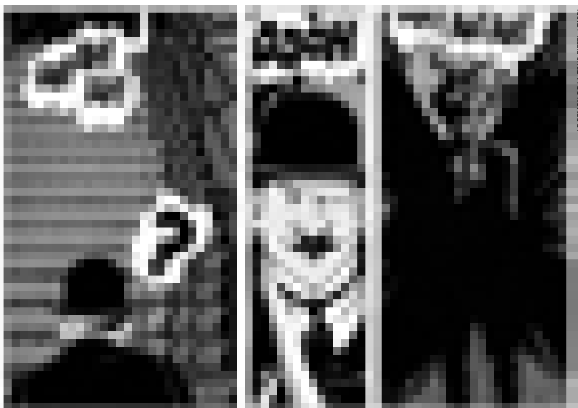
LE DEMON DE LA TOUR EIFFEL / TARDI