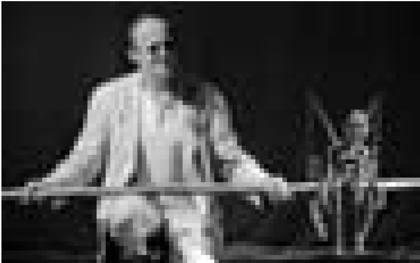
Ein Mann der gute Figur macht: Das Figurentheater Tübingen in „Mit riesen- großen Flügeln“.

„Stuttgarter Zeitung“ das magische Verschmelzen der Grenzen. Es ist die poetische Geschichte eines zugleich engelhaften und alten, zerzausten Hühnerwesens, das geradezu vom Himmel fällt, in den Garten einer Familie, dessen fieberkrankes Kind auf wundersame Weise geheilt wird und das fabelhafte Wesen zu einer „Engelattraktion“ werden lässt. Am Ende fliegt dieses dann doch davon und wird zu einem „imaginären Punkt am Horizont des Meeres“. Hier sind Fantasie und Realität ganz nah beieinander und die Existenz von Grenzen, die Orientierung und Halt geben, wird hinterfragt, wenn auch auf eine ganz andere Weise als in dem Stück „P.P.P.“.