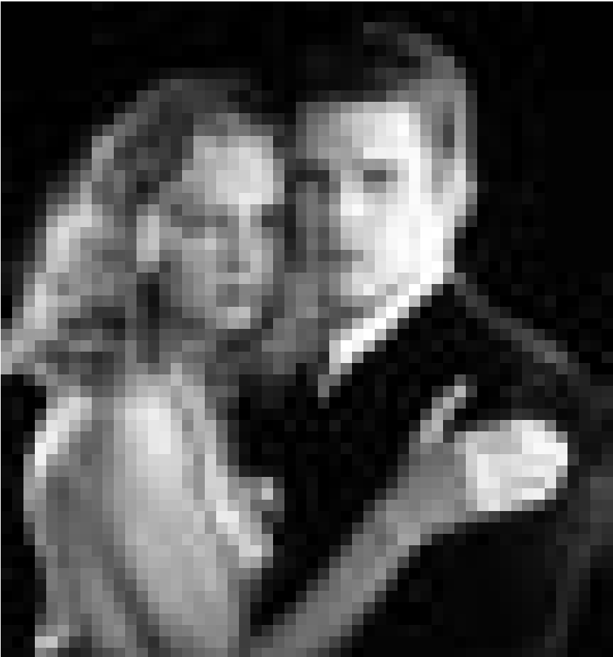
Sieht mit vierzig immer noch gut aus und das ganz ohne Gentechnik : Uma Thurman in „Gattaca“, Sonntag in der Cinémathèque.

Di, 4.5., 18h30. Une jeune femme a connu un jeune homme pendant les vacances. Ils se sont aimés, mais, ne se sont pas donné la possibilité de se retrouver. La jeune femme n'a jamais vraiment pu remplacer cet amour lumineux. Elle recherche l'homme de sa vie qu'elle a une chance sur des millions de retrouver par hasard. (Cycle Contes des quatre saisons : II)