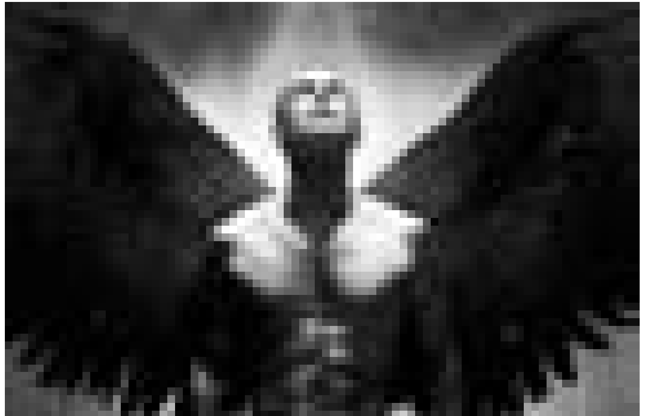
Weiss nicht ob er nicht doch die Menschheit retten soll : Paul Bettany in „Legion“, neu im Utopolis und CinéBelval.

En 1912, Adèle Blanc-Sec, jeune journaliste intrépide débarque en Egypte et se retrouve avec des momies de tout genre. Au même moment à Paris un oeuf de ptérodactyle, vieux de 136