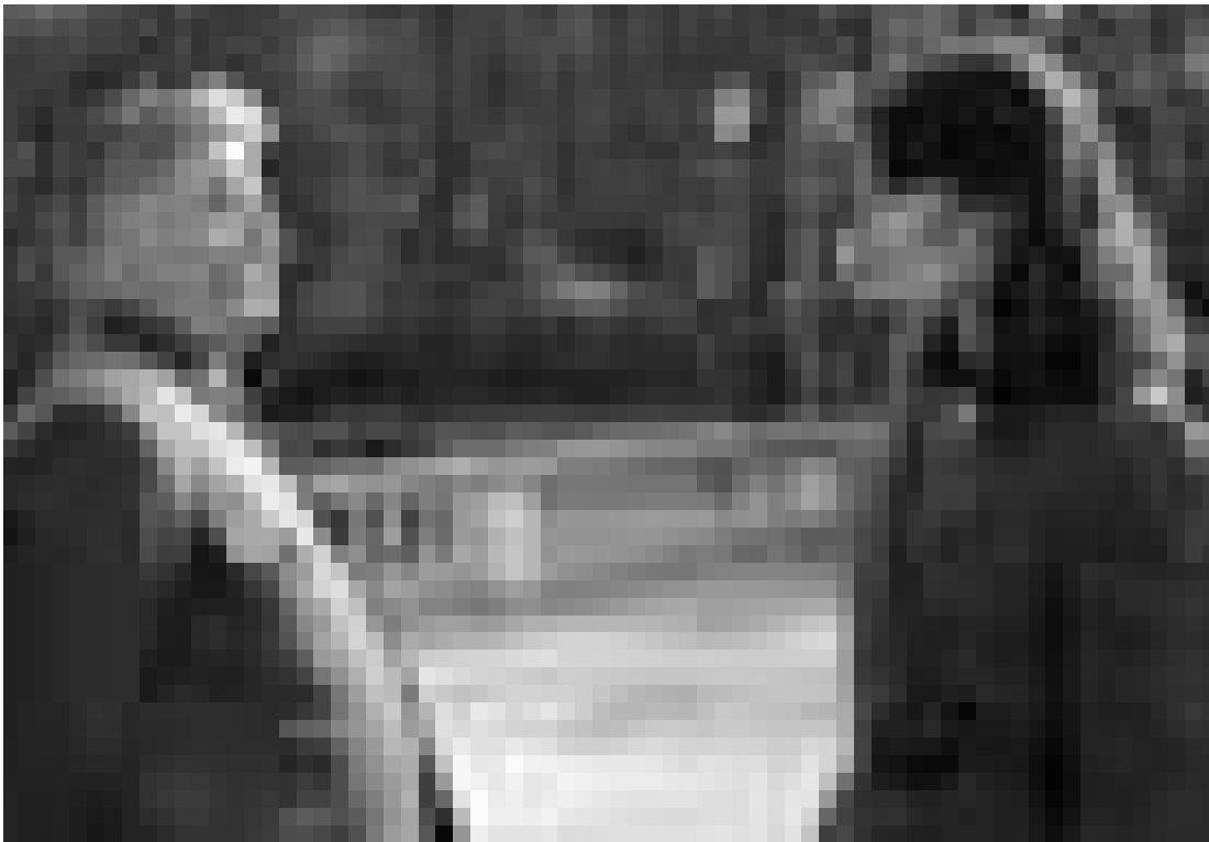
La Belle et la Bête, version 1953...