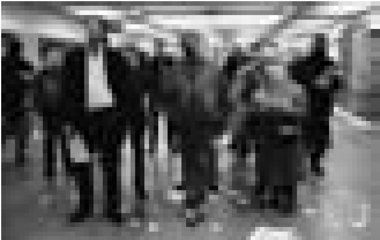
Da kann man sich schon mal wundern: « Ceci n'est pas un Casino », im Casino-Forum d'art contemporain, bis zum 5. September.

photographie, Espace 2 de la Galerie Clairefontaine (21, rue du St-Esprit,