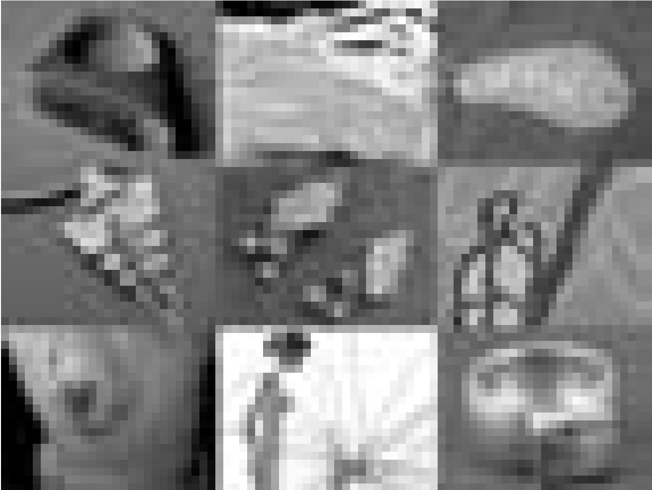
Plus que double : six artistes luxembourgeois-e-s sont à l'affiche de « Double Face », la nouvelle exposition au Kunschthaus beim Engel, du 1er au 13 juin.

peintures, Galerie d'Art Schortgen (24, rue Beaumont, tél. 26 20 15 10), jusqu'au 17.6, ma. - sa. 10h30 - 12h30 + 13h30 - 18h.