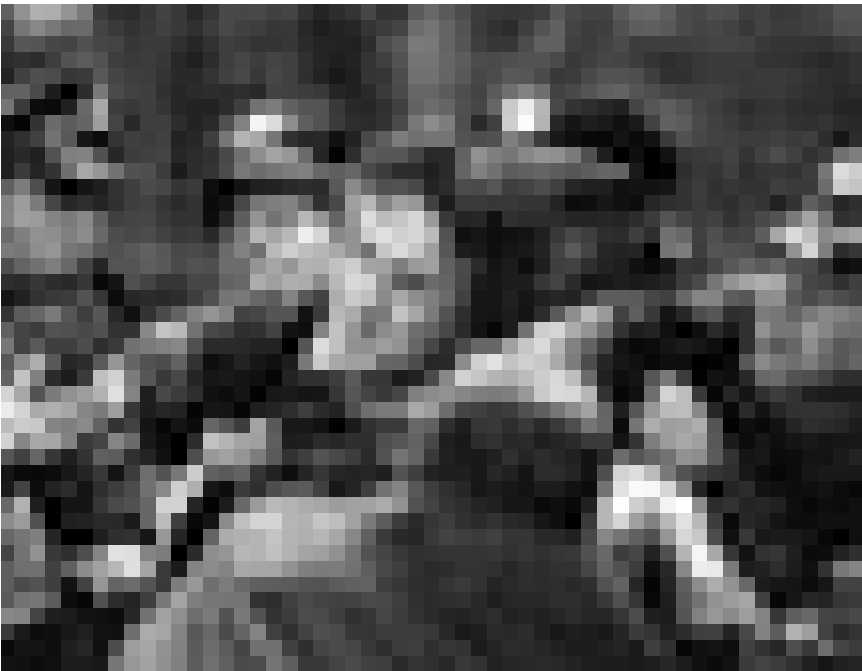
Un classique récent : Sean Penn dans « Mystic River » de Clint Eastwood. Vendredi à la Cinémathèque.

Un scénario faible et une mise en scène hésitante vampirisent toute la bonne humeur du spectateur en moins d'une heure. (lc)