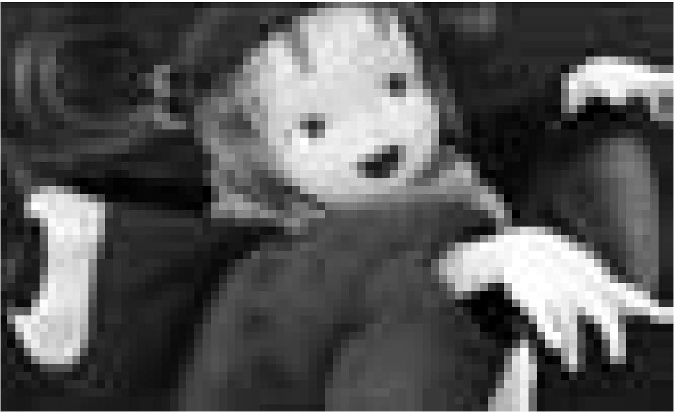
Elle se déguise en pingouin pour mieux savoir voler : « Yona Yona Pinguin » - film d'animation nippon. Nouveau à l'Utopia.