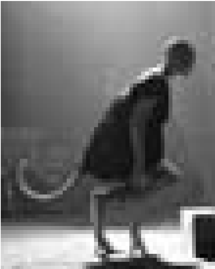
Halb Mensch, halb Gemüse: Keine Couchpotatoe, sondern ein eigenartiges und gefährliches Wesen - „Splice“, neu im Utopolis und im CinéBelval.