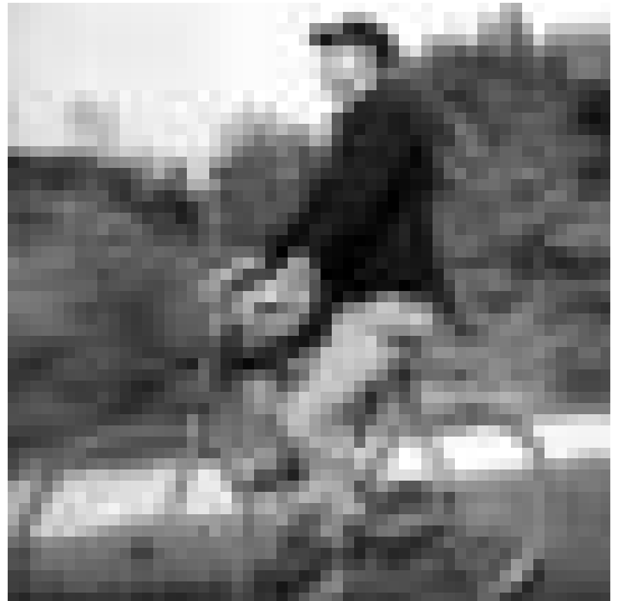
« Jour de Fête » - le film de Jacques Tati à la gloire du héroïque postier cycliste sera à la Cinémathèque ce lundi, à l'occasion des 25 années de la Lëtzebuerger Vëlos-Initiativ (LVI).

Keng, le jeune soldat, et Tong, le garçon de la campagne mènent une vie douce et agréable. Le temps s'écoule, rythmé par les sorties en ville, les matchs de foot et les soirées