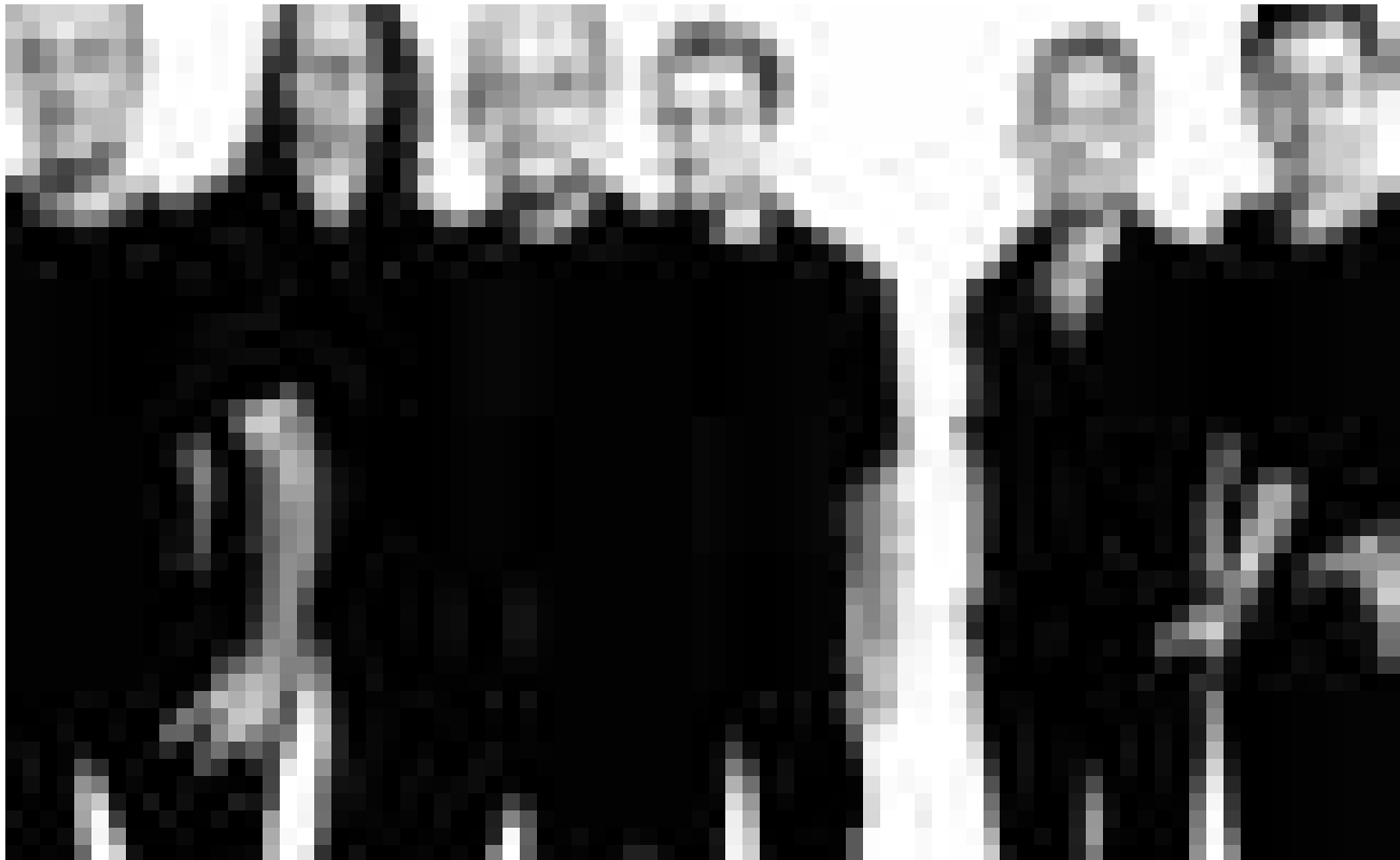
Durchtrainiert und gut gelaunt: „Six Pack“, A-Cappella-Comedy-Show, am 29. Januar im Echternacher Trifolion.

Luxembourg, 17h30. Tél. 46 66 44-6563/6560.