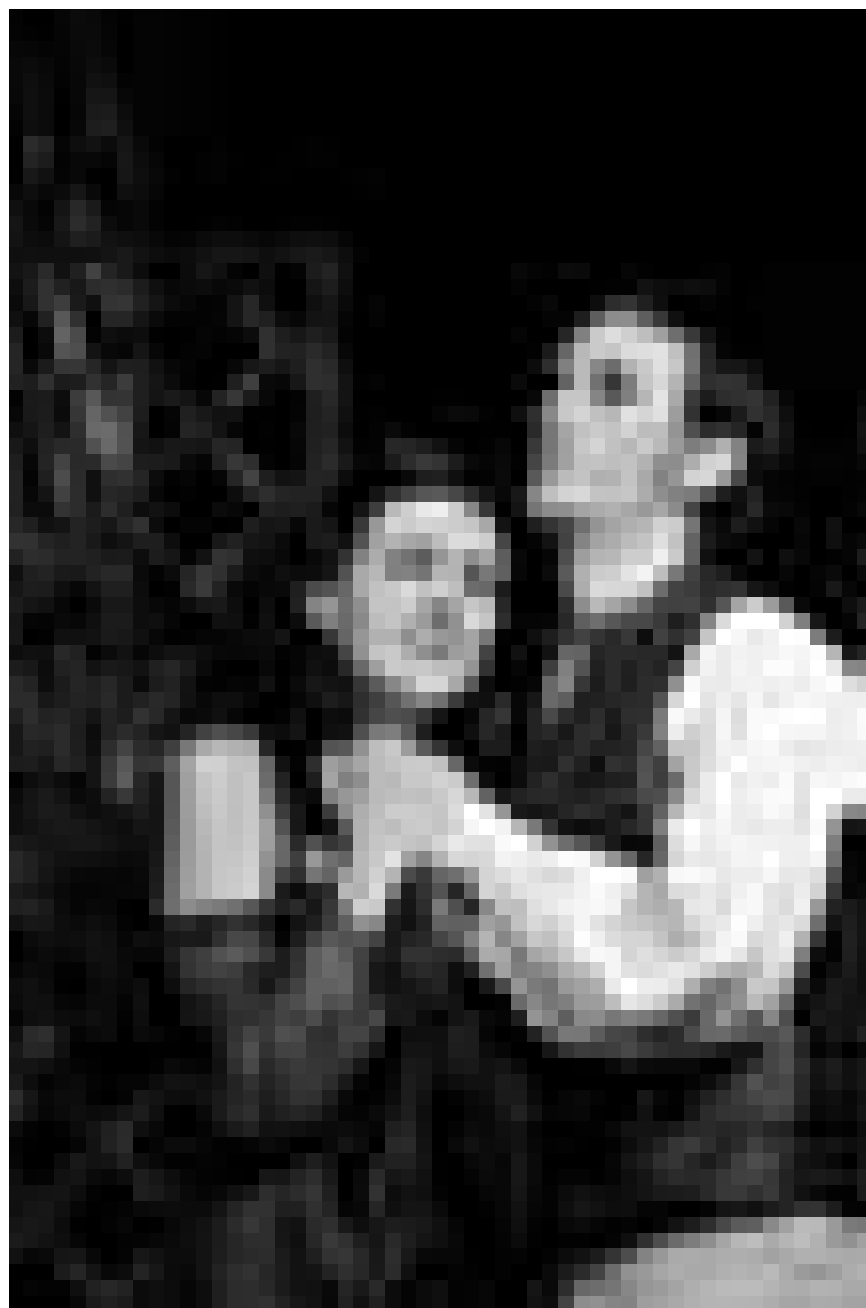
Düster, romantisch und ein bisschen blutig : „Rappacini's Tochter“, Gothic-Musical nach der Kurzgeschichte von Nathaniel Hawthorne, am 29. Januar im Cape in Ettelbrück.

Himmel-Hölle/ Ciel-Enfer , Cattenom oder die vier apokalyptischen Reiter von umd mit Gulden/Thewes,