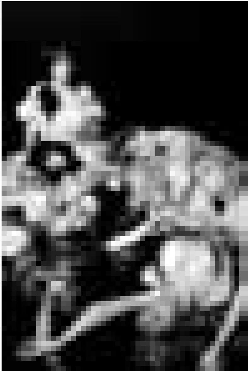
„The Toten Crackhuren im Kofferraum“ - hier eher halbtot.

getreu dem Phänomen der „Self-Fulfilling-Prophecy“ - denn irgendwann war wirklich jemand naiv oder mutig genug die Band zu buchen.