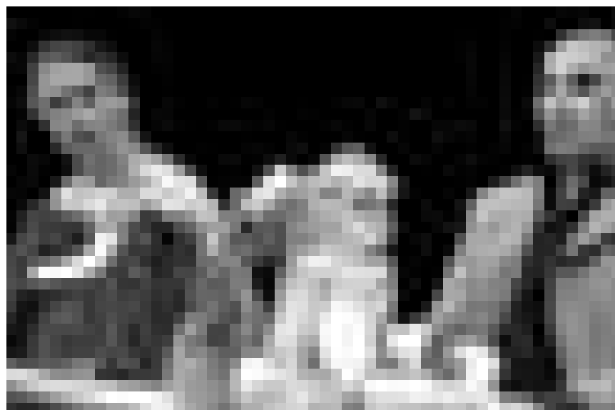
„König Drosselbart“ lässt am 16. und am 17. Januar im Carré Rotondes die Puppen und auch die Schauspieler tanzen.

Der Kontrabass , Monolog von Patrick Süskind, Studio des Theaters, Trier (D) , 20h. Tél. 0049 651 7 18 18 18.