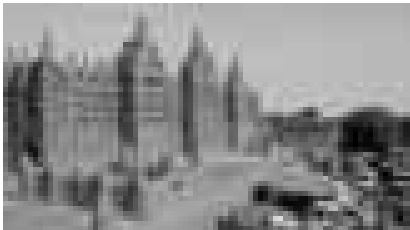
L'exploration d'un des lieux les plus reculés de la planète : « Destination Toumbouctou », aura lieu le 18 janvier au Cape d'Ettelbruck.

Les personnages rebelles de l'Orlando Furioso de Ludovico Ariosto , par Gian Paolo Giudicetti, Bibliothèque de l'Istituto Italiano di Cultura, Luxembourg , 18h30.