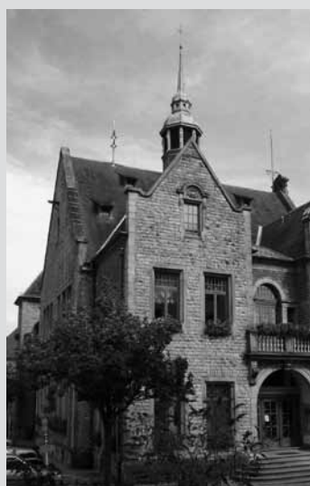
Table Ronde - Mëttwoch 9. Mäerz - 19.30 Auer - Exit07 CarréRotondes 1, rue de l'Acierie, L-1112 Luxembourg-Hollerich

D'Demokratie leeft vun der Representativitéit. Ginn eis Gemengeréit deem wierklech gerecht? Wou si mer mat der Präsenz vun de Fraen drun? Firwat sinn esou wéineg auslännesch Leit, Jonker oder Leit aus dem Aarbechtermilieu an der Gemengepolitik aktiv? Froen, déi ustinn, lo wou d'Lëscht fir d'Gemengewahlen opgestallt ginn.