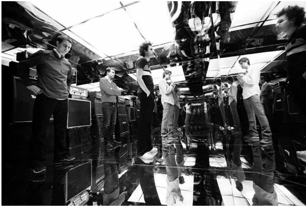
Prêts pour la guerre des tympanes : Battles.