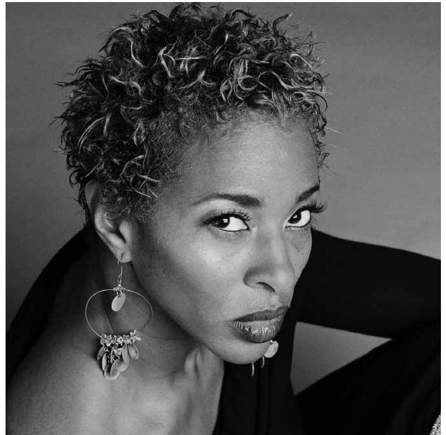
Temperamentvoll ist die kanadische Blues- und Jazz-Sängerin Shakura S'Aida. Zu sehen am 1. April im Sang a Klang.