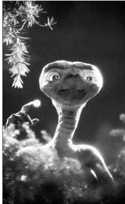
Schon vor 30 Jahren funkte der Außerirdische E.T. nach Hause. „E.T.“, zu sehen in der Cinémathèque.