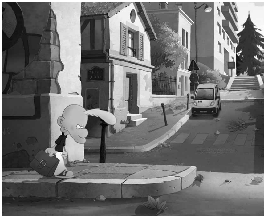
Une mèche blonde ne suffit pas pour séduire les filles. Titeuf doit bien faire des efforts. La bande dessinée est à découvrir à l'Utopolis et au CinéBelval.

USA 2010 von David O. Russell. Mit Mark Wahlberg, Christian Bale und Melissa Leo. 117'. O.-Ton, fr. + nl. Ut. Ab 16.