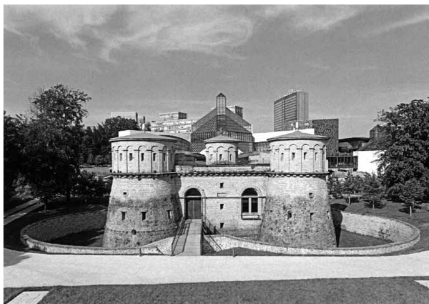
Alt vor Neu: das Fort Thüngen vor dem Mudam. Aufnahmen von Carlo Hommel zeigt das Comité Alstad im Kunschthaus beim Engel noch bis zum 8. Mai.