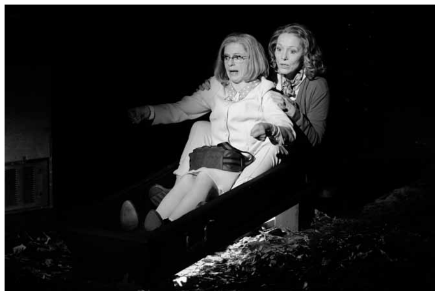
„Zwei nette kleine Damen auf dem Weg nach Norden“ ist ein eigenwilliger, absurd komischer Roadtrip und wird am 28. April im Cube 521 in Marnach aufgeführt.

Wëllkräiderexcursioun , Rendez-vous beim Waasserbaseng op der Strooss tëscht Kéinzig an Käerjeng, Clemency , 14h30.