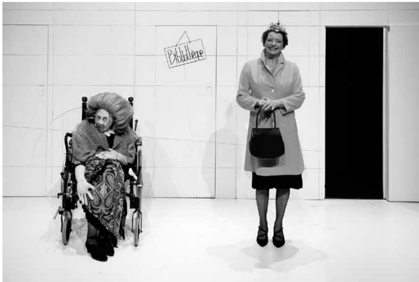
« Le mensuel », relecture parodique de l'actualité, le 14 mai à la maison de la culture d'Arlon.

Großer Saal, Trier (D), 20h. Tel. 0049 651 7 18 24 12.