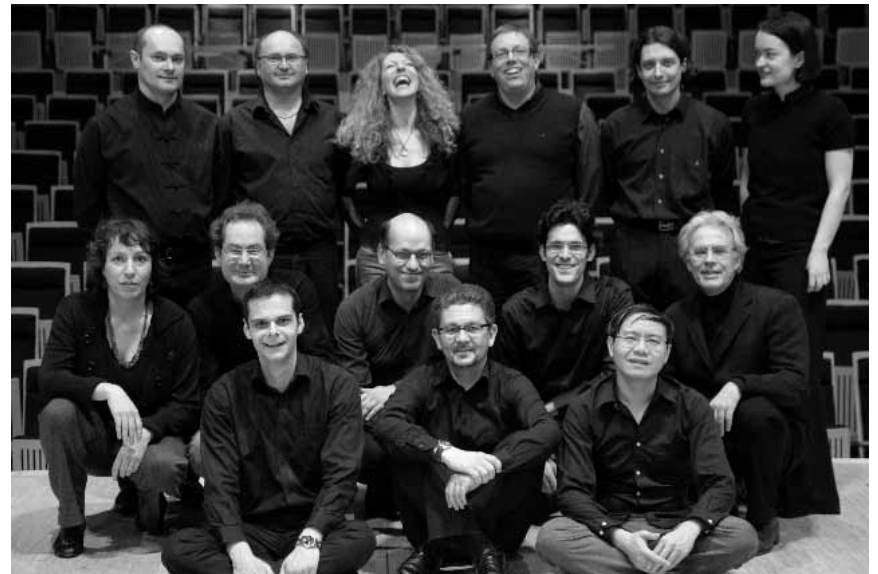
Mit Werken von Brahms und Reuter begeht der Kammermusikverein Luxemburg am 8. Mai sein 25. Jubiläum im Centre des Arts pluriels in Ettelbrück.