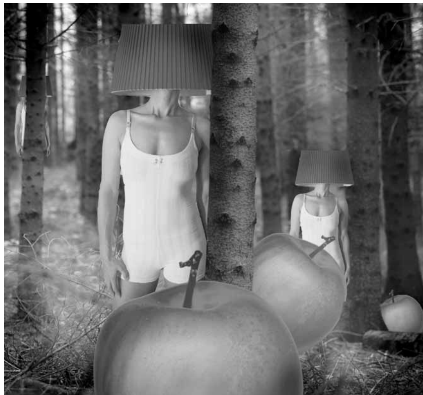
Marie-Lune vous emballera avec son spectacle-valise « Bric à Brac », les 13 et 14 mai au Mierscher Kulturhaus.

Guy Schadeck Quintet , jazz, Brasserie Le Neumünster (Centre culturel de rencontre Abbaye de Neumünster), Luxembourg , 11h30. Tél. 26 20 52 981.