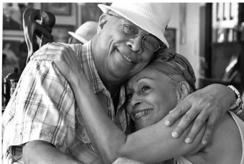
Bringen Kuba in die Philharmonie: Omara Portuondo und Chucho Valdés, am 9. Mai.