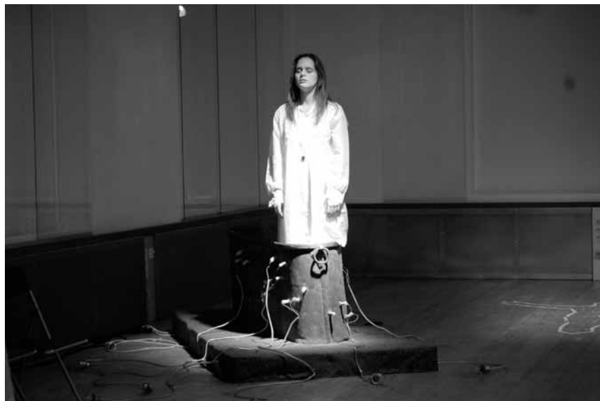
Stephen King ne vous fait même pas peur ? Allez voir la pièce « Carrie » d'après son célèbre roman, les 28 et 29 septembre au Kapuzinertheater.

Présentation-rencontre avec la compositrice Michiru Oshima , Cité Auditorium, Luxembourg , 19h.