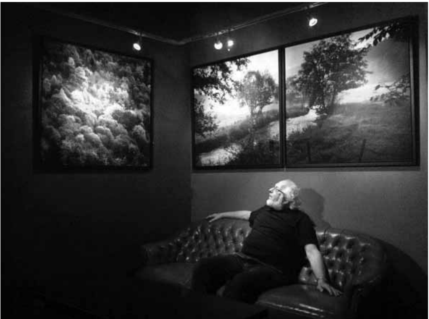
Etwas Natur an der Wand: Die großformatigen Fotos von Raymond Clement über die Gegenden Oewersauer und Our sind im Viandener Ancien Cinéma zu sehen, bis zum 2. Oktober.

Adriana Woll: Up Down Frau'n NEW Foyer des Finanzministeriums des Saarlandes (Am Stadtgraben 6-8), bis zum 21.10., Mo. - Fr. 7h - 18h.