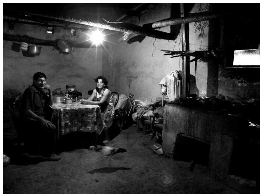
Den Süden entdecken im Märchenpark: „Face2Face“, Fotoausstellung im Parc Merveilleux in Bettembourg, noch bis zum 9. Oktober.