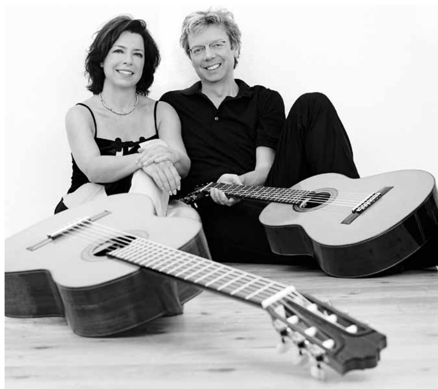
Gitarrenmusik aus vielen Jahrhunderten und von verschiedenen Kontinenten spielt das „Amadeus Guitar Duo“ am 1. Oktober im Cape in Ettelbrück.