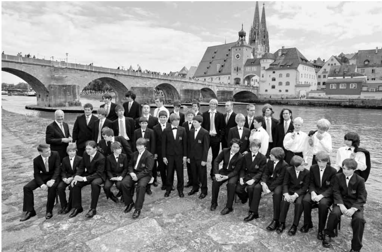
Der Papst ist zwar schon wieder weg, zu Singen gibt's aber immer was: „Die Regensburger Domspatzen“ am 9. Oktober in der Ludwigskirche in Saarbrücken.

Soprano , rap, Rockhal, Club, Esch, 21h.