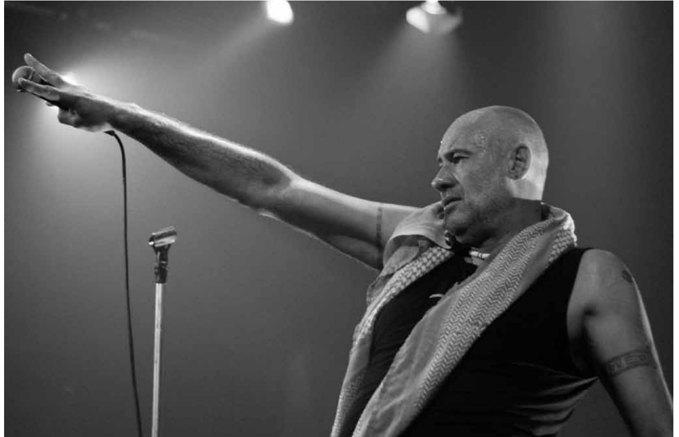
Für seine Fans ist er immer noch der größte im Teich: „Fish“ am 5. Oktober im Theater am Ring in Saarlouis.

Brett Anderson , en avant-programme Spirals, Den Atelier, Luxembourg , 21h. www.atelier.lu