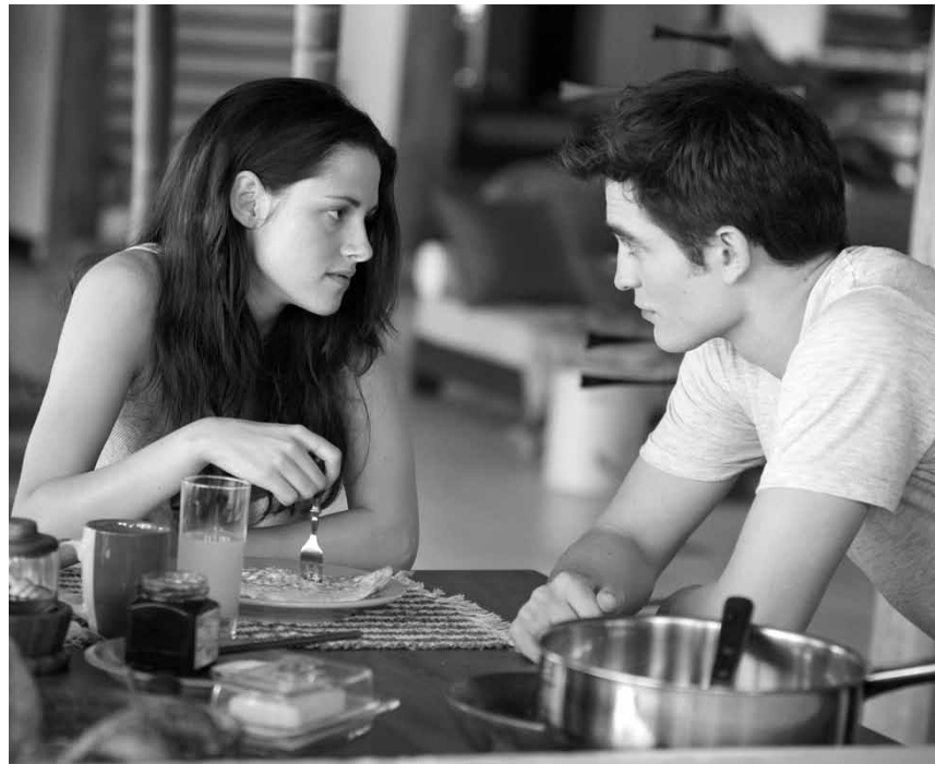
Wenn Vampire Nachwuchs zeugen, dann sorgt das natürlich für einigen Ärger. „The Twilight Saga: Breaking Dawn“, Vorpremiere im Utopolis und CinéBelval.

I 2011 de Michele Placido. Avec Kim Rossi Stuart, Filippo Timi et Moritz Bleibtreu. 111'. V.o., s.-t. fr. A partir de 16 ans.