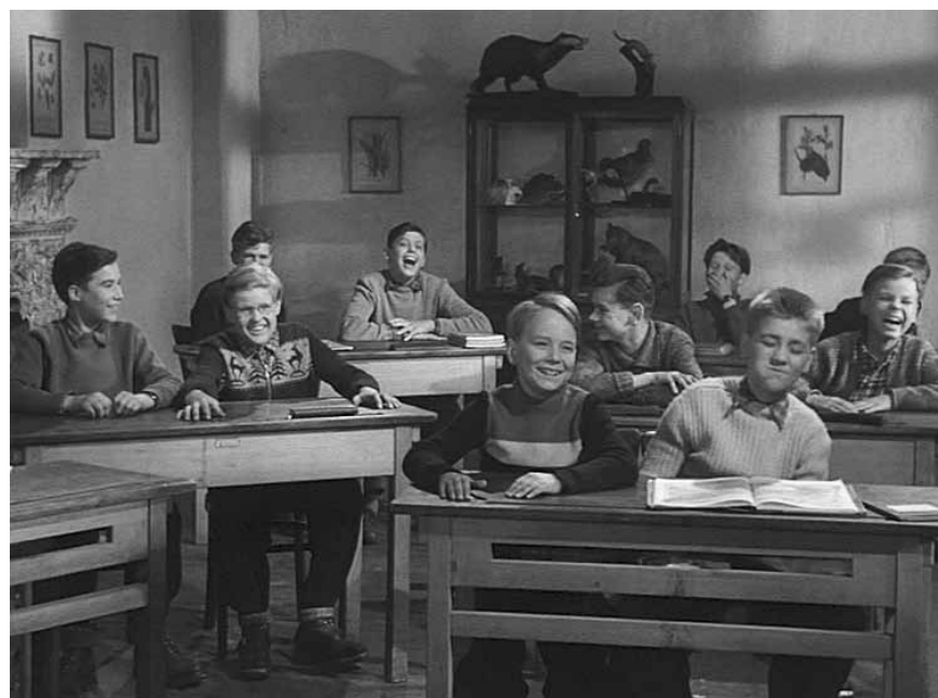
Im „Das fliegende Klassenzimmer“ haben die Schüler das Sagen. Am Sonntag in der Cinémathèque.

an asylum, steals a jackhammer and proceeds to open up a main street and traffic artery in Tel Aviv. Rather than question his actions, the police, as well as city officials, assume he is operating under the municipality's orders and aid him as much as they can.