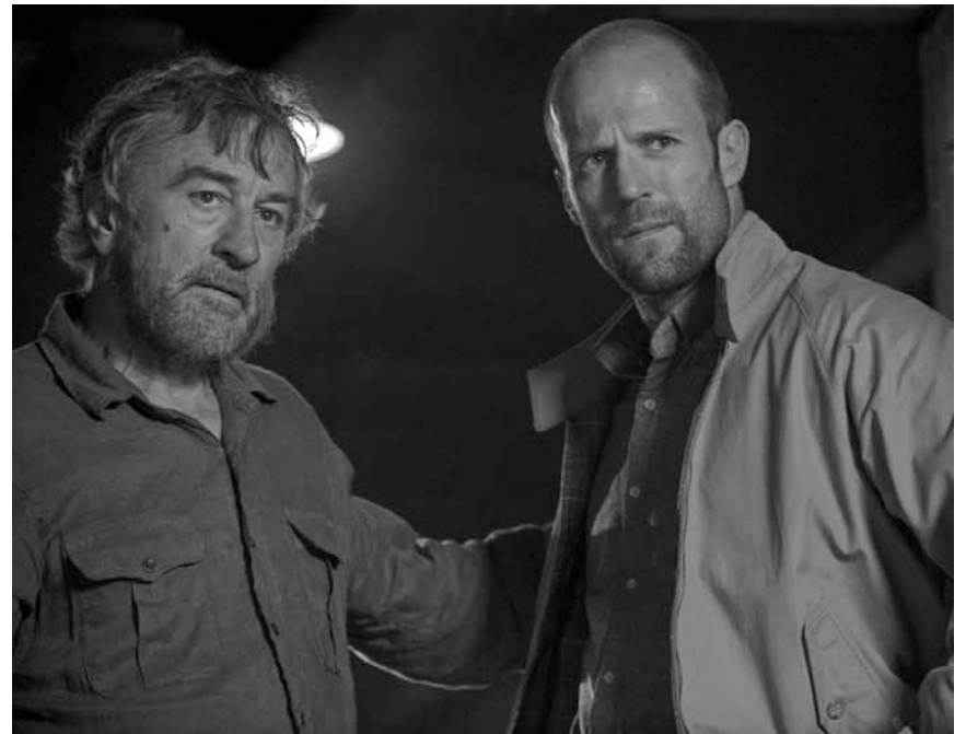
Als Auftragskiller ist das Aussteigen aus dem Metier nicht einfach. „Killer Elite“, neu im Utopolis und CinéBelval.

C'est l'été, Zak et Seth se retrouvent seuls et sans argent dans leur maison de campagne. Les deux frères