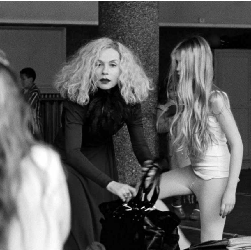
Dans „My little princess“ une mère abuse de sa fille. Nouveau à l'Utopia.

Avant-programme vun der Originalversion: Mëllech a Botter L 1929, Documentaire vu Pierre Bertogne an Alfred Heinen. 42'. O.V.