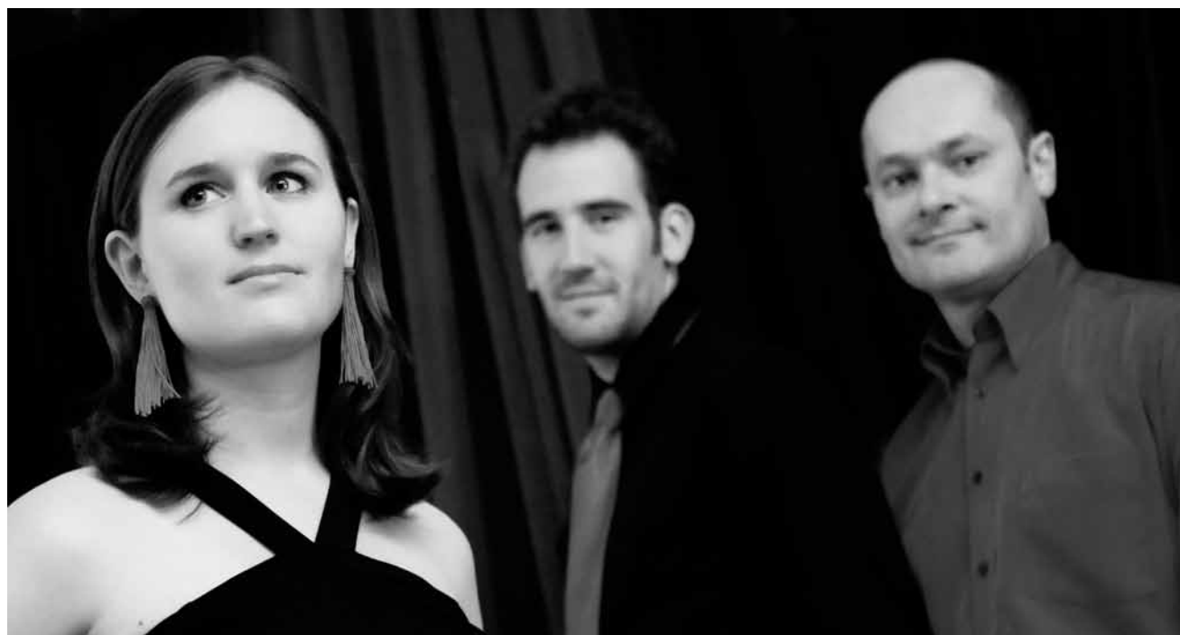
Fasziniert von der Musik Astor Piazzollas, spezialisieren sich die drei Musiker von „Daly“ auf die Interpretation des „Tango nuevo“. Daly gastiert am 13. November im Trifolion in Echternach.

La dualité du photon , par Alain Aspect, Auditorium Tavenas, Bâtiment