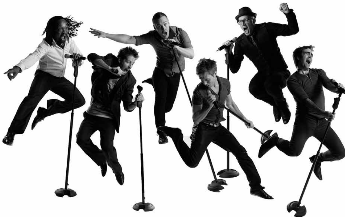
Auf Erfolgskurs: Die Mitglieder des Londoner Sextetts „The Magnets“ strapazieren ihre Stimmbänder am 18. November im Centre des Arts Pluriels Ed. Juncker in Ettelbrück.

Spettatori , Bewegungstheater, Centre culturel régional opderschmelz, Dudelange , 20h. Tel. 51 61 21-290.