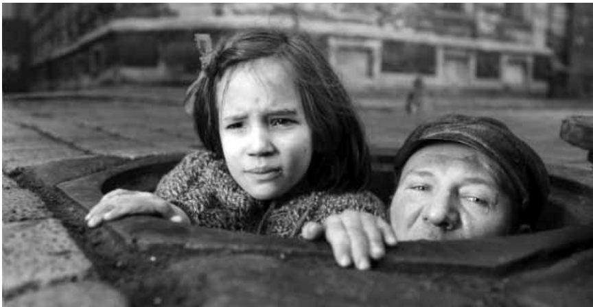
L'histoire d'un homme qui découvre l'humanisme en action: „W ciemnosci“, vendredi à la Cinémathèque dans le cadre du Festival cinEast suivi par la cérémonie d'attribution des Prix du Festival.

La Nouvelle-Orléans, en 1951. Pedro, scénariste brillant, mystérieux, proba-