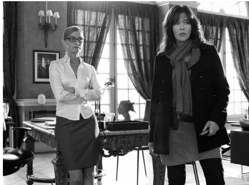
Jeu de dupes dans le grand banditisme français : « De force », avant-première jeudi à l'Utopolis.

Jamie überzeugt Dylan davon, sein altes Leben hinter sich zu lassen und zu ihr nach New York zu ziehen. Gesagt, getan, doch dann merken beide, dass sie wieder ihren ungünstigen Routinen