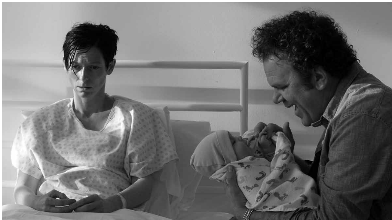
Eine Familie im Unglück zwischen Vergangenheit und schmerzvoller Gegenwart: „We Need to talk about Kevin“, neu im Utopia.