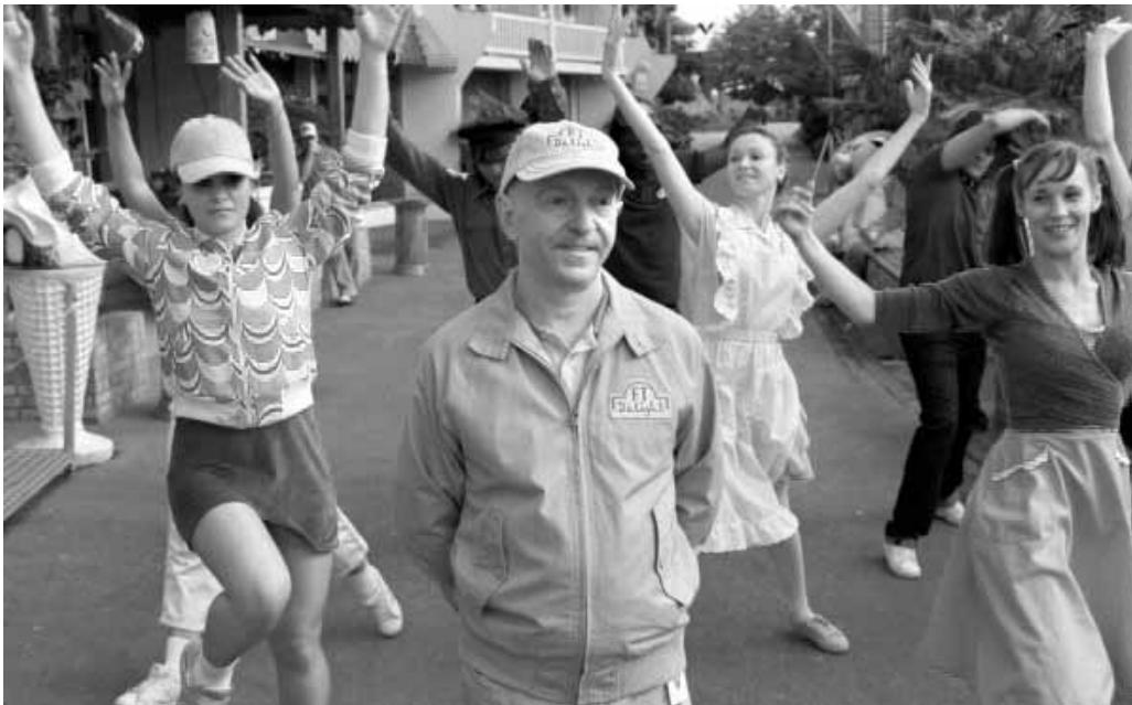
La chance lui chante enfin...