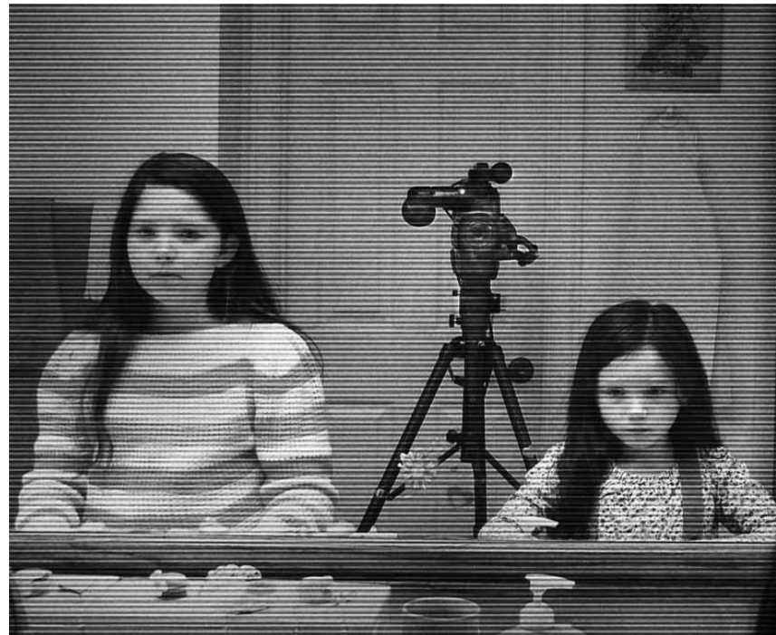
Wer zum Fürchten ins Kino geht, kommt hier garantiert auf seine Kosten: „Paranormal Activity 3“ neu im Utopolis und CinéBelval.

Glaubt man einem Zeitungsartikel, so hat eine Frau im Leben durchschnittlich 10,5 Sexualpartner. Ally Darling, die schon seit längerem auf der Suche nach der großen Liebe ist, liegt mit insgesamt 20 über diesem Durchschnitt. War der Mann ihrer Träume vielleicht schon dabei, ohne dass sie es gemerkt hat? Ally tut sich mit ihrem gutaussehenden Nachbarn zusammen, um genau das herauszufinden.