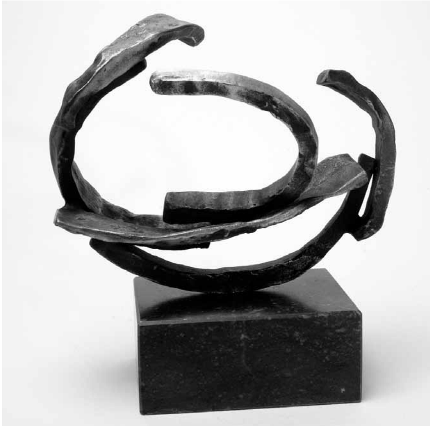
Iva Mrazkova expose ses sculptures ensemble avec les peintures de Malou Faber-Hilbert à l'espace Médiart, du 26 octobre au 17 novembre.

Eechelen, tél. 45 37 85-1), jusqu'au 6.11, lu., je. - di. 11h - 18h, me. nocturne jusqu'à 20h.