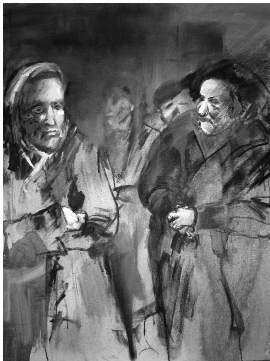
Le quotidien reste une source d'inspiration pour les artistes : « Scènes de vie », peintures de Patrice Schannes, à l'espace Beau Site d'Arlon, jusqu'au 6 novembre.