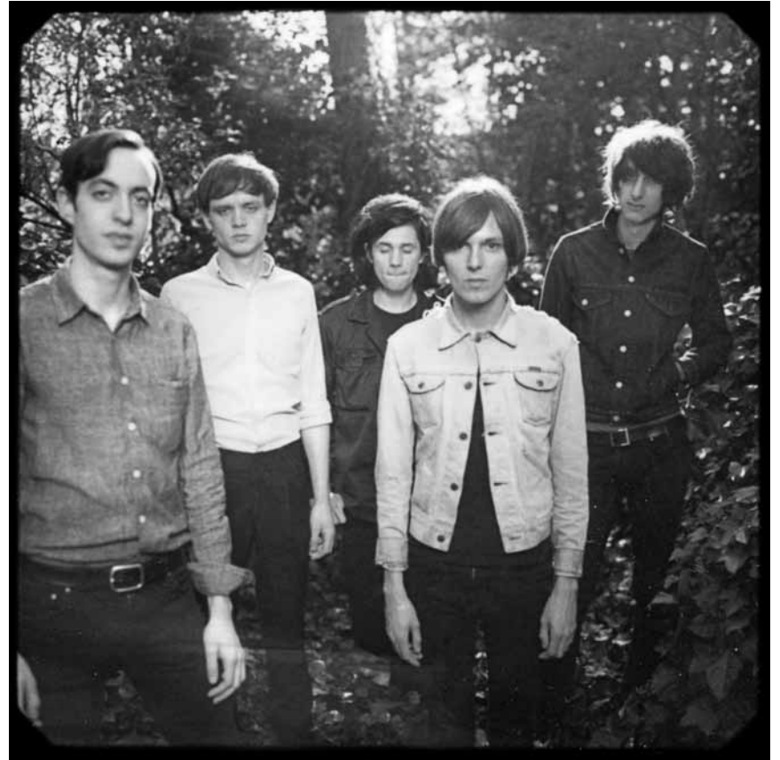
So schlimm sehen sie nun auch wieder nicht aus: „The Horrors“, am 12. Dezember im Atelier.

Christmas Market, Café Ancien Cinéma, Vianden, 12h - 18h. Tel. 26 87 45 32.