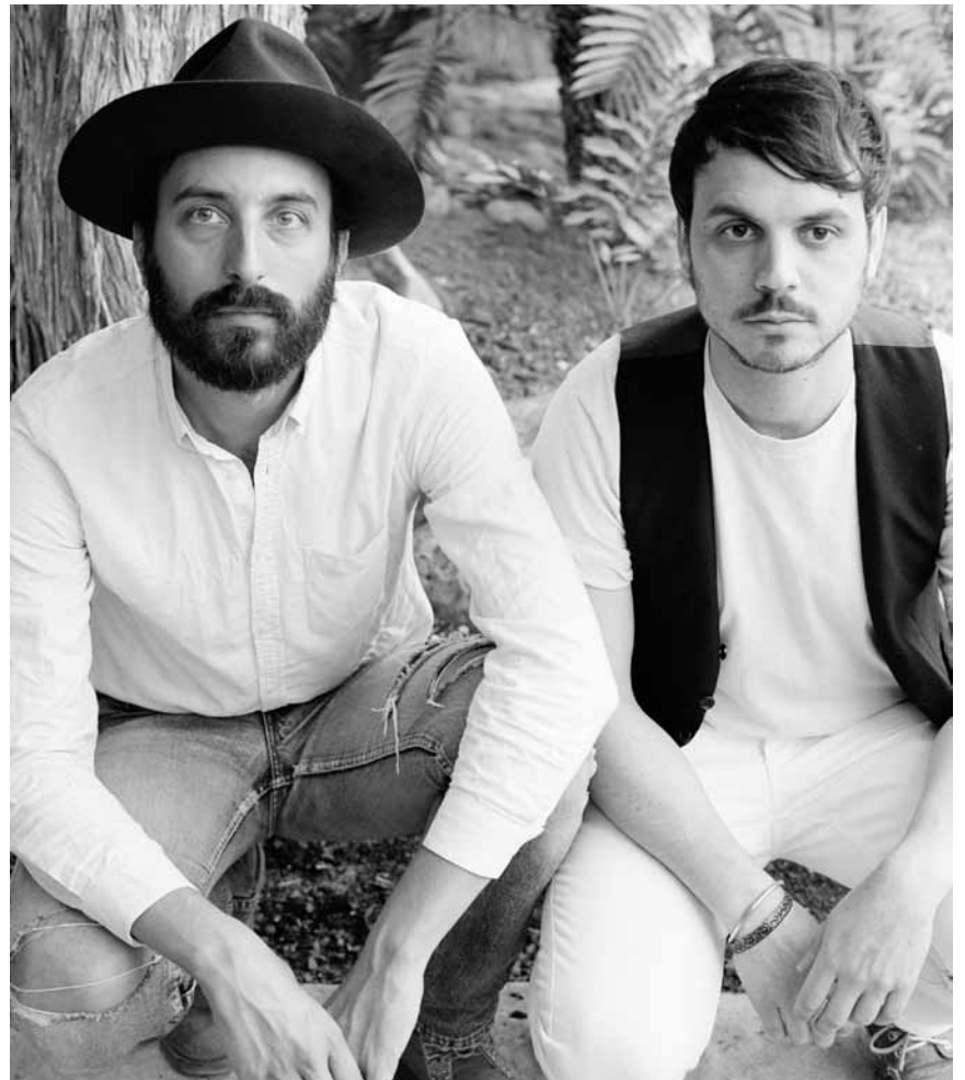
Ce n'est pas tous les weekends qu'on a droit à une aussi belle affiche : le duo indie-pop français « Herman Dune » sera à l'Exit07, ce vendredi 9 décembre.