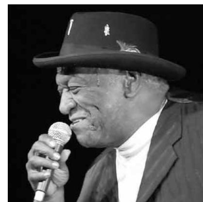
Se la jouera cool : Big Pete and the Gamblers sera au Sang a Klang ce vendredi 9 décembre.

Endstation Sehnsucht , von Tennessee Williams, Alte Feuerwache, Saarbrücken (D) , 19h30. Tél. 0049 681 30 92-0.