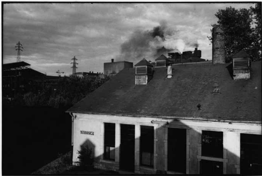
WOLFGANG OSTERHELD, COLLECTION LIEWEN AM MINETT, 1986