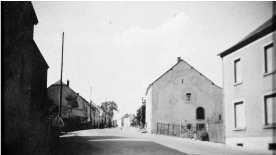
BACHE, COLLECTION HISTORIQUE : COMMUNE DE FEULEN, ENTRE 1910 ET 1980