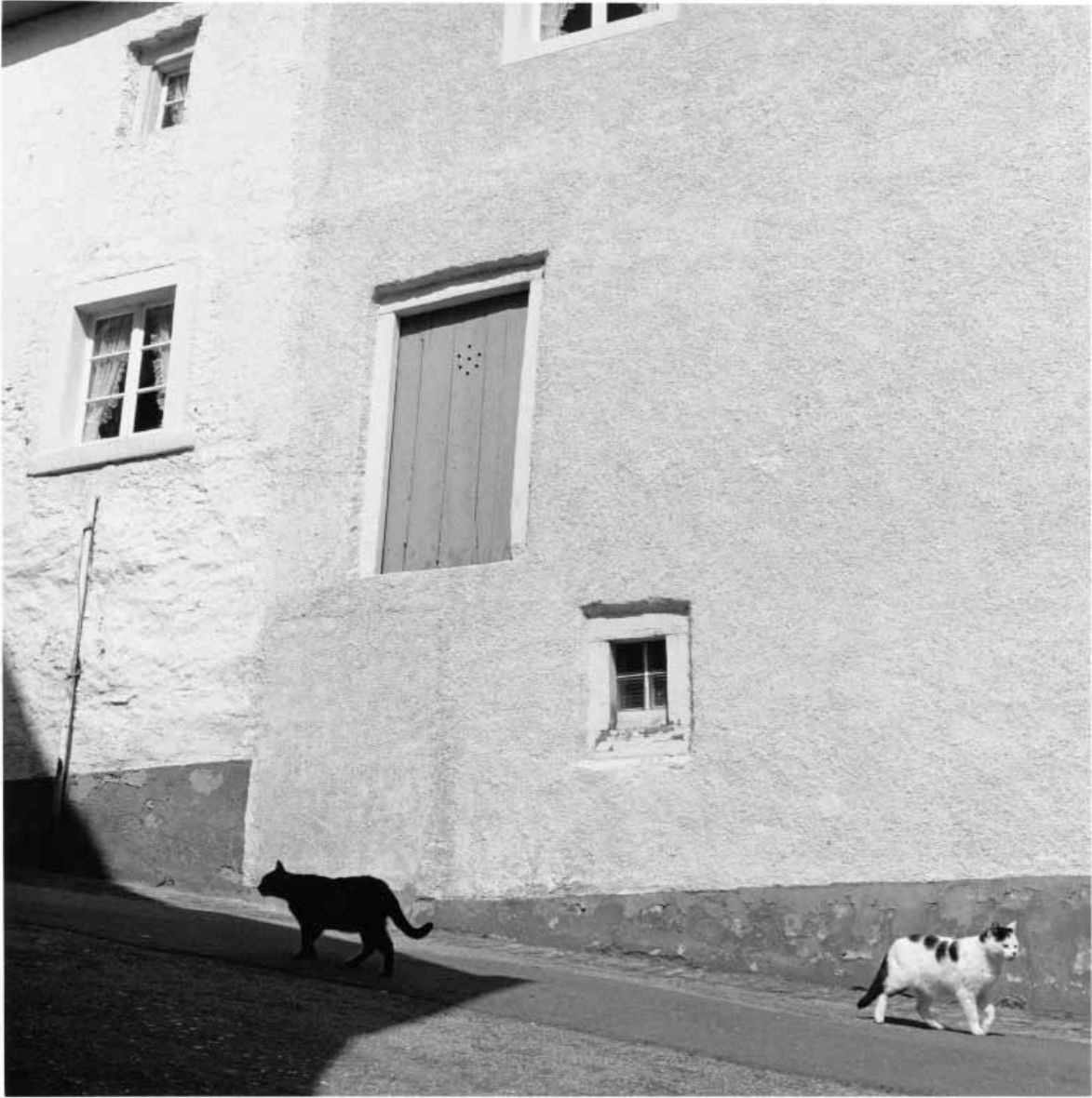
YVON LAMBERT, COLLECTION LIEWEN AM EISECK, 1988

Avec son projet CARTE BLANCHE, l'hebdomadaire woxx met ses pages centrales à disposition des instituts culturels luxembourgeois. Pendant six éditions, ils peuvent disposer librement de cet espace pour offrir un aperçu de leurs collections.