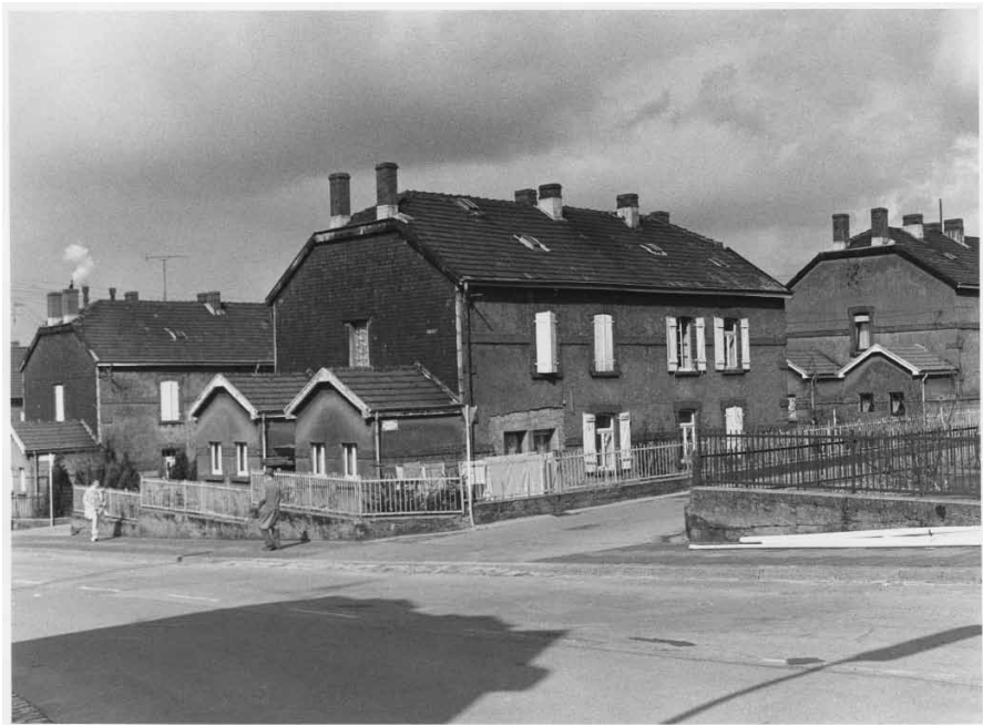
JEAN DIDERICH, COLLECTION LIEWEN AM MINETT, 1986

Des mots génèrent des images et rejouent les collections photographiques du CNA.