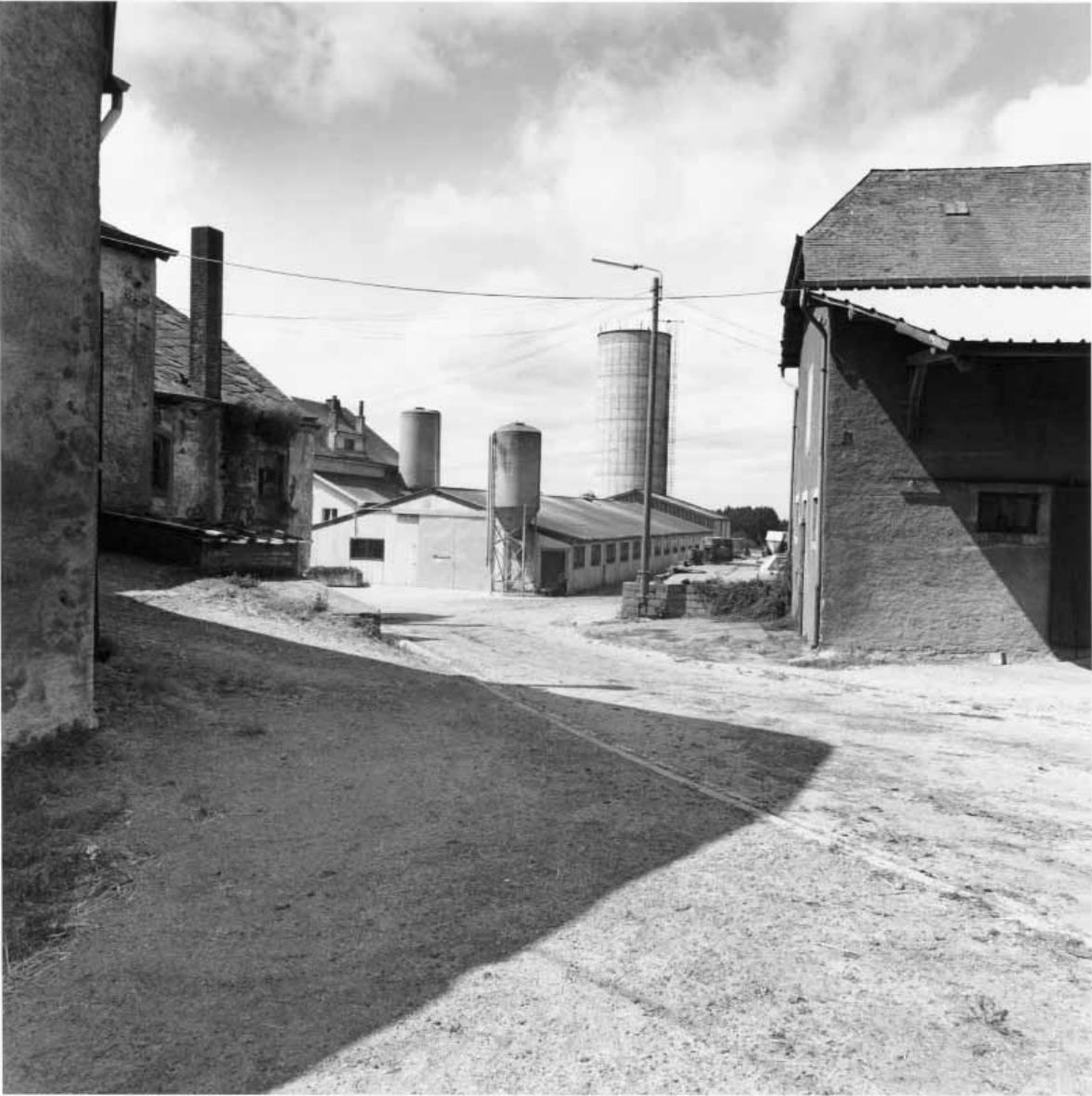
MARC KALSBUCH, COLLECTION LIEWEN AM EISECK, SANS DATE