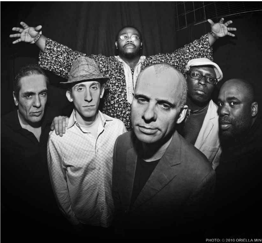
Le « New York Ska Ensemble » sera à la ferme Madelonne à Sterpigny le 18 décembre.

Bartsch, Kindermörder , Monolog von Oliver Reese, Landgericht, Trier (D) , 20h. Tel. 0049 651 7 18 18 18.