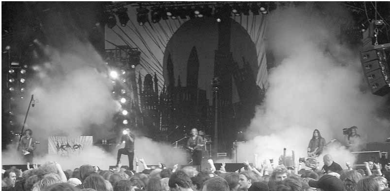
Promis, ça va barder avec « Heaven Shall Burn ».