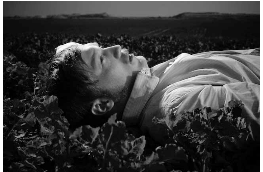
Island landet mal wieder im Exit07: The Field, Elektro-Duo und A Boy Named Seb, am 16. Dezember.