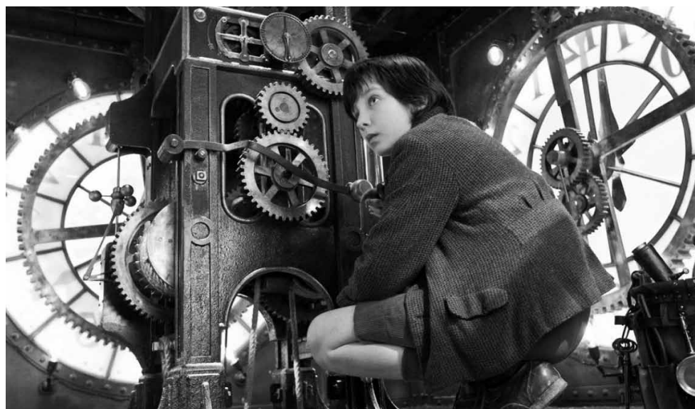
Auch Automaten müssen am Leben erhalten werden.

Als Terroristen einen Anschlag auf der Kreml in Moskau verüben, stellt die US-Regierung eine verdeckte Eliteeinheit namens „Phantom Protokoll“ auf die Beine. Ethan Hunt und seine Impossible Mission Force (IMF) sollen für die Anschläge verantwortlich gemacht werden, haben aber zugleich die Möglichkeit, als Teil des Plans zu fliehen und so im Untergrund zu arbeiten.