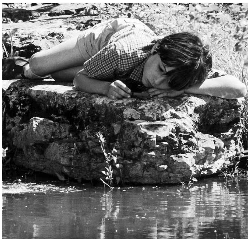
Quand Narcisse tourne au cauchemar : « La clé des champs », le dernier film de Claude Nuridsany et Marie Pérennou est nouveau cette semaine à l'Utopia.