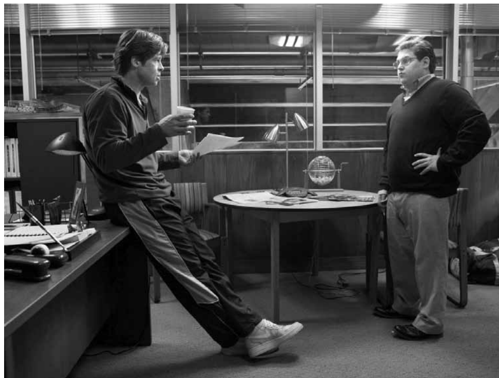
Baseball ausrechnen statt zu spielen, das ganze Konzept der ungleichen Spielemacher.