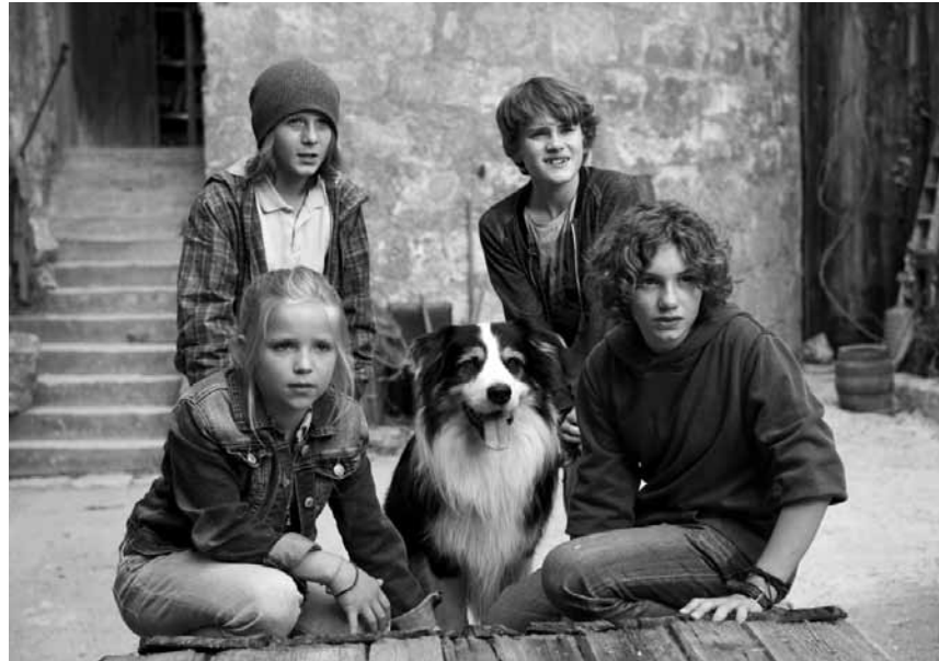
Durch dick und dünn - die „Fünf Freunde“, ein alter Kinderbuchklassiker nun auch auf der großen Leinwand. Neu im Utopolis, CinéBelval und Kursaal.

Der gestiefelte Kater wurde von seinem vermeintlichen Freund Humpty Dumpty betrogen. Fortan muss er anderswo sein Glück versuchen und will dem Gängsterpärchen Jack und Jill drei magische Bohnen entwenden. Doch auch die Katze Kitty Softpaws,