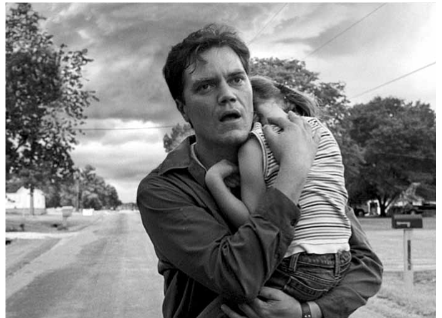
Curtis Leben gerät aus allen Fugen. „Take Shelter“. Neu im Utopolis.

Curtis lebt mit seiner Frau und ihrer sechs Jahre alten, gehörlosen Tochter in einer Kleinstadt in Ohio. Als Curtis von schrecklichen Träumen heimgesucht wird, beginnt er wie besessen an einem Sturm-Schutzbunker auf seinem Hinterhof zu arbeiten. Sein scheinbar unerklärliches Verhalten sorgt für Spannungen in seiner Ehe. Die sind aber nicht zu vergleichen mit seiner Angst, dass seine Träume wahr werden könnten.