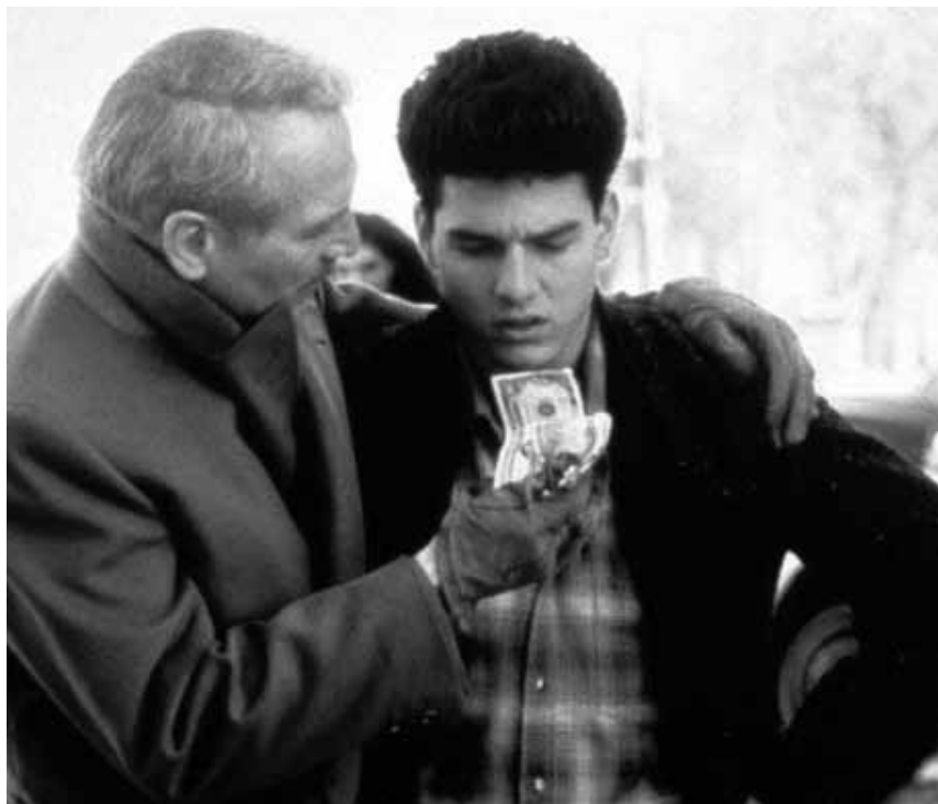
Dans „The color of Money“, il n'est pas question de placer de l'argent. Mercredi à la Cinémathèque.

Als auf Allegra Geller, Entwicklerin von Computerspielen, beim Test ihres neuesten Produkts „eXistenZ“ ein Mordanschlag verübt wird, flieht sie mit dem jungen Praktikanten Ted aus dem Labor. Leider wird bei dem Attentat der organische Schaltkreis, auf dem die einzige Kopie des Spielprogramms gespeichert ist, beschädigt. Ted lässt sich einen Gameport in den eigenen Körper implantieren, damit Allegra mit ihm „eXistenZ“ testen kann.