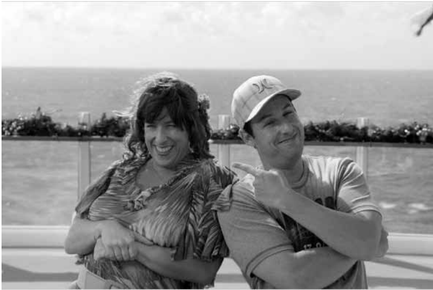
Wer zuletzt lacht, lacht am Besten - „Jack and Jill“, neu im Utopolis und CinéBelval.

les nouveaux talents de cet art envoûtant, le réalisateur nous propose un véritable voyage au cœur du flamenco, de sa lumière, de ses couleurs.