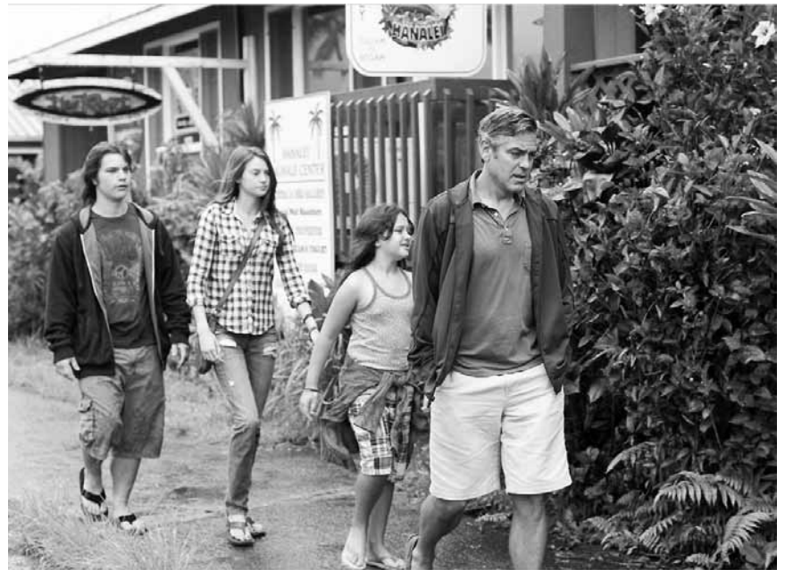
Erst Präsidentschaftskandidat und nun betrogener Ehemann mit zwei Kindern im Schlepptau. George Clooney in „The Descendants“, neu im Utopolis.