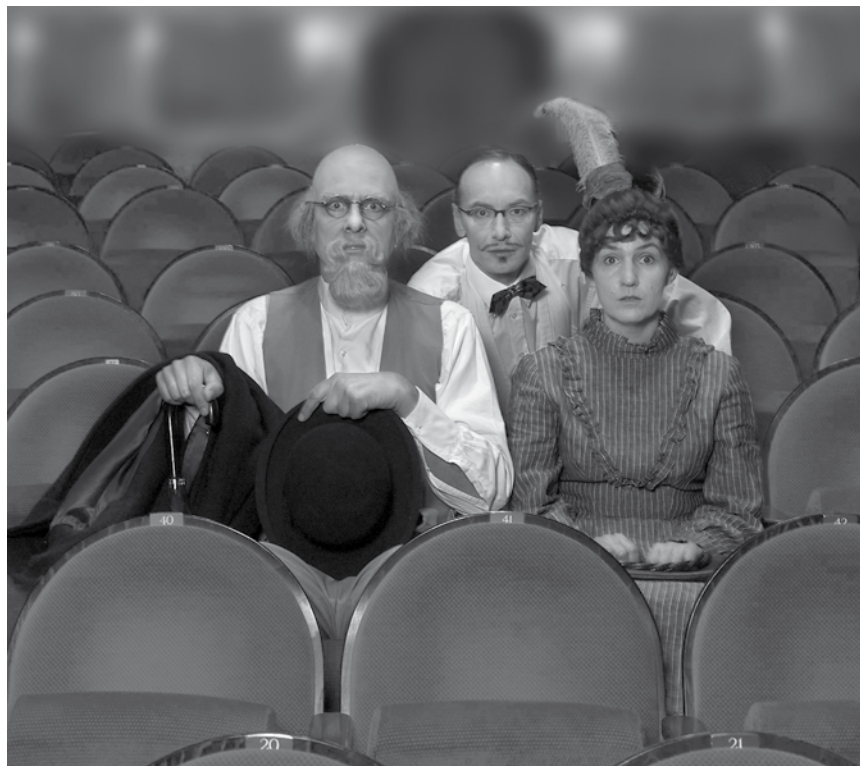
In „Carl Valentins Theaterbesuch“ werden Monologe und Dialoge von Karl Valentin zu abendfüllenden Theaterstücken verbunden. Am 5. Februar im Cube 521 in Marnach.

E Liewen op Staatskäschen , gespielt vum Theaterveräin Fëschbech, Schous, Angsbreg asbl, Op der Héicht, Schoos , 20h15. Tél. 621 47 89 40.