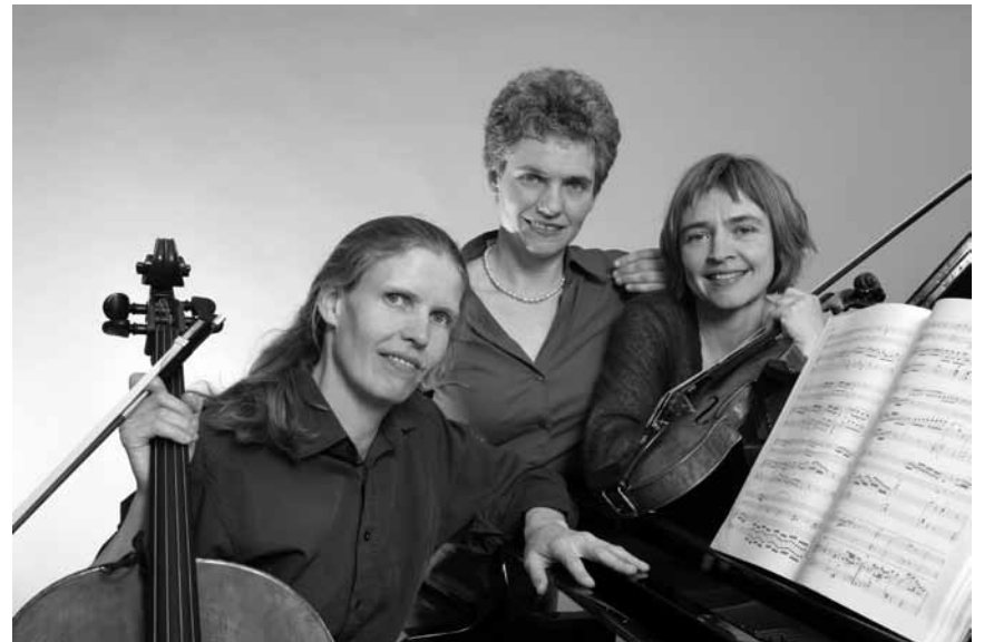
Le « Trio Vivente » se distingue par sa spontanéité sur scène. Ils seront en concert ce vendredi, le 27 janvier à l'Eglise Protestante avec des œuvres de Carl Reinecke et de Robert Schumann.