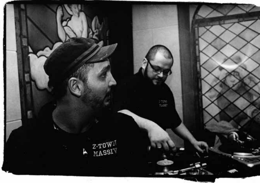
L'autre face du hip-hop à la luxembourgeoise: Z-Town Massive.