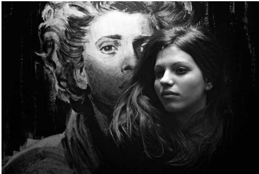
Schwer aus der Reserve zu locken: Anja Franziska Plaschg alias „Soap & Skin“.