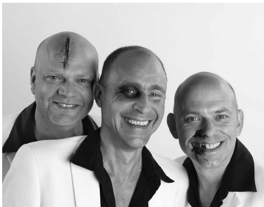
Nach 20 Jahren Comedy kommt der Abschied: „Ganz schön Feist“ lassen es am 2. März in der Trierer Tufa noch mal so richtig knallen.

Terres rouges : Histoire de la sidérurgie luxembourgeoise, présentation du livre suivi d'une