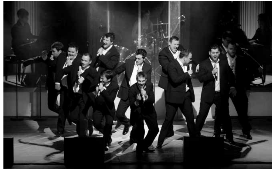
Große Showeinlage am 1. März im Conservatoire der Stadt Luxemburg: „The 12 Tenors feat. The 10 Sopranos“, bringen leichte Opernkost, poppig und unkompliziert.