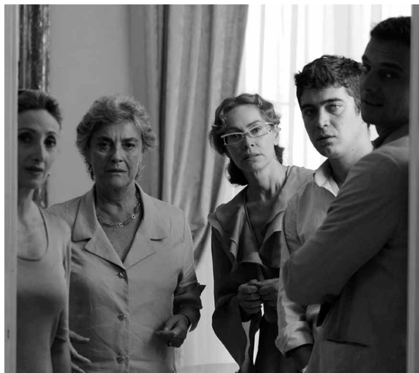
Une réunion familiale à l'italienne qui tourne au désastre: « Mine Vaganti », Cinédit, mercredi et jeudi à l'Utopia.