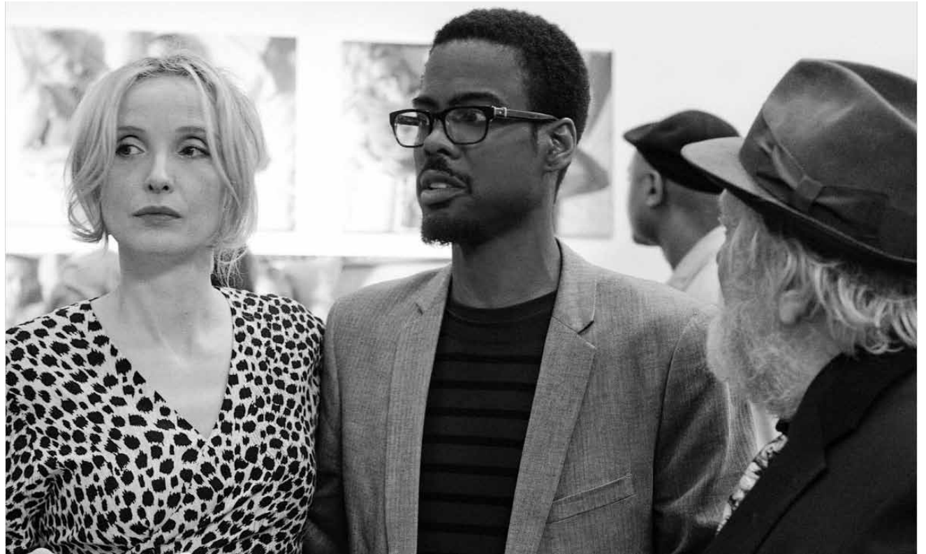
Deux jours suffisent pour provoquer le chaos dans la vie de Marion : « 2 Days in New York », vendredi à la Cinémathèque, dans le cadre du festival Discovery Zone.

1927 : Don Lockwood et Lina Lamont forment un couple de stars du cinéma adulé par le public. Leur dernier film vient d'obtenir un énorme succès, et, pour échapper à la foule de ses admiratrices déchaînées, Don saute dans la voiture d'une inconnue. Elle s'appelle Kathy et fait partie d'une troupe de danseuses.