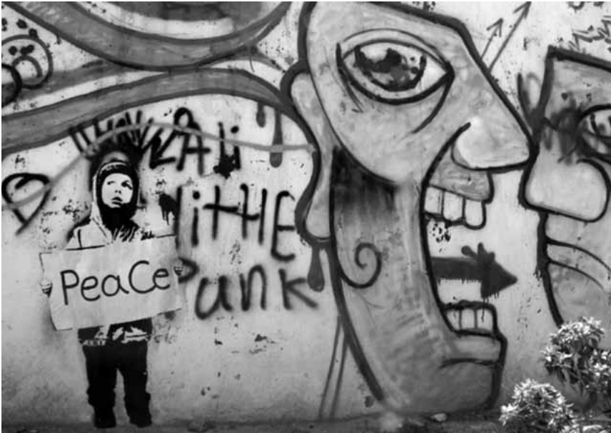
Une réalisatrice parcourt les zones de crise pour y trouver l'espoir: « Cultures of Resistance », Cinéclub, lundi à l'Ariston.

USA 2011 von McG. Mit Reese Witherspoon, Chris Pine und Tom Hardy. 94'. Ab 12.