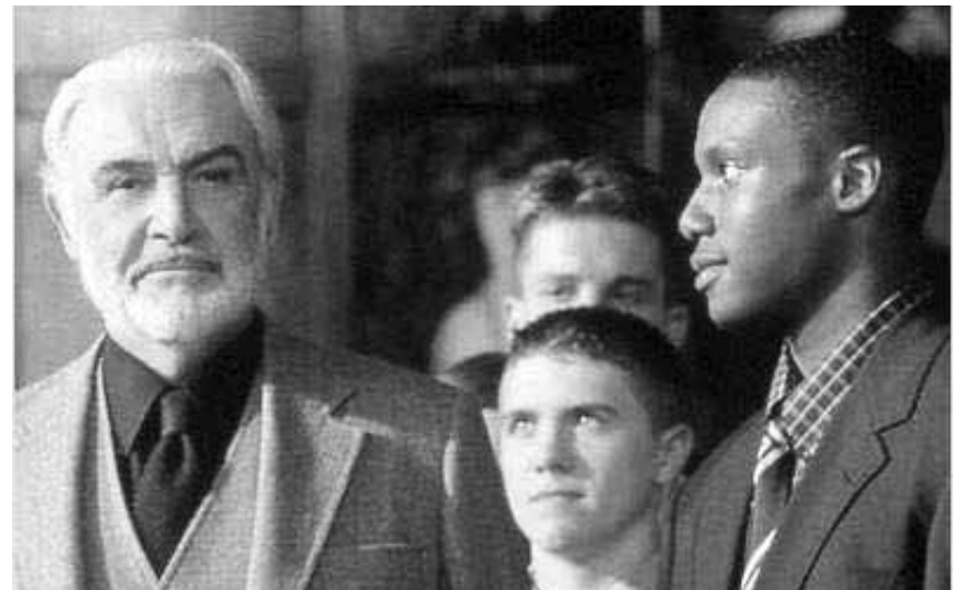
La rencontre entre un jeune basketteur et un vieil auteur oublié est au centre de « Finding Forrester », de Gus Van Sant, mercredi à la Cinémathèque.

Will Hunting ist 20 und, obwohl er nie studiert hat, ein besserer Denker als die meisten Studenten im Massachusetts Institute of Technology, wo Will nur als Hilfskraft arbeitet. Obwohl ein Mathematikprofessor sich für ihn zu interessieren beginnt, wird es erstmal nichts mit der Wissenschaft: Will kann gelegentlich auch sehr zornig werden, hat gerade einen Polizisten verdroschen und soll dafür ins Gefängnis. Es sei denn, er unterzieht sich einer Therapie.