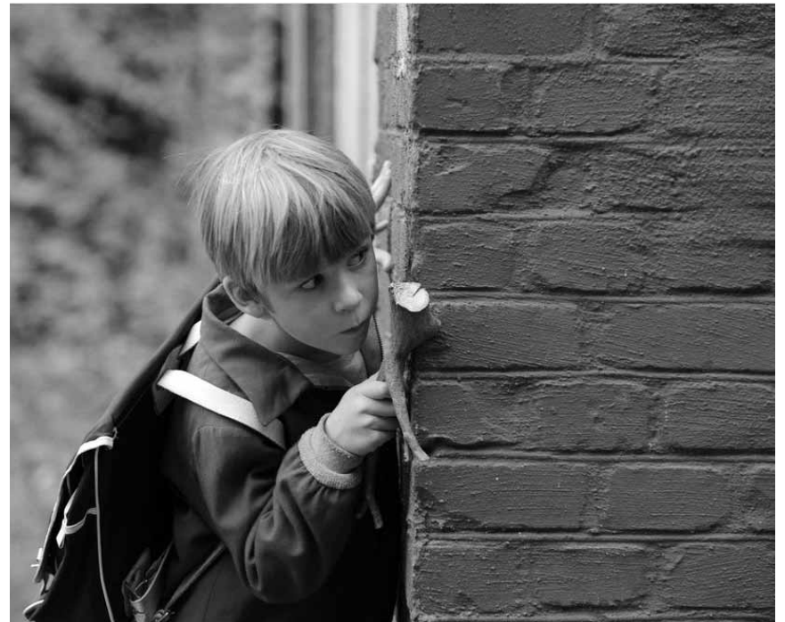
„Knerten traut sich“ - der norwegische Kinderfilm geht in die zweite Runde und diesmal geht es um einen geheimnisvollen Autounfall. Neu im Kursaal und CinéBelval.

Die USA sind wegen Kriegen und Naturkatastrophen zusammengebrochen. Aus den Trümmern ist der Staat Panem entstanden wo jedes Jahr grausame Gladiatorenspiele veranstaltet werden, bei denen nur eine einzige Person überlebt. 24 Jugendliche nehmen an den Spielen teil. Auch Katniss soll gegen ihren Freund Peeta bis zum