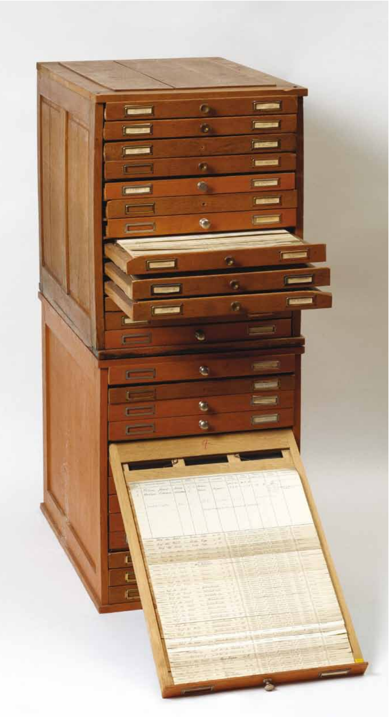
Fichier reprenant les maisons construites par l'Arbed et vendues dans les années 1970, s.d.

Avec son projet CARTE BLANCHE, l'hebdomadaire woxx met ses pages centrales à disposition des instituts culturels luxembourgeois. Pendant six éditions, ils peuvent disposer librement de cet espace pour offrir un aperçu de leurs collections.