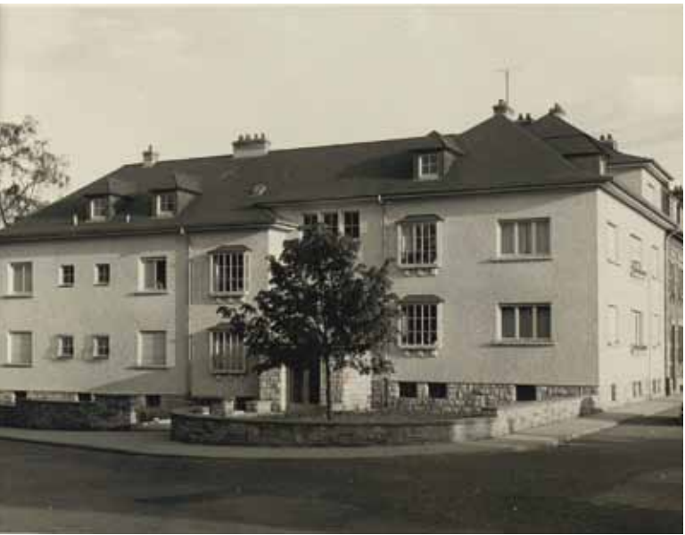
Maison à quatre appartements pour ingénieurs, rue de la Liberté, Dudelange (1952)