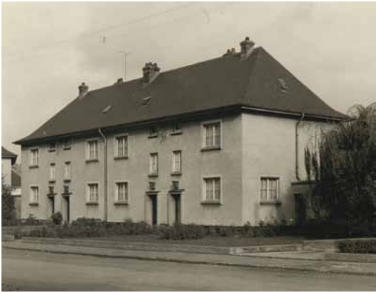
Maisons ouvrières au Brill, Dudelange (1948)