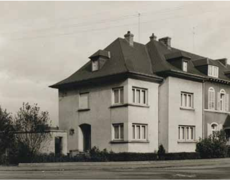
Maison d'ingénieur au Brill, Dudelange (1948)