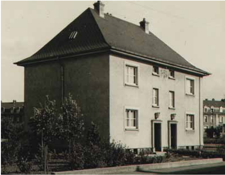
Maison ouvrière au Brill, Dudelange (1948)