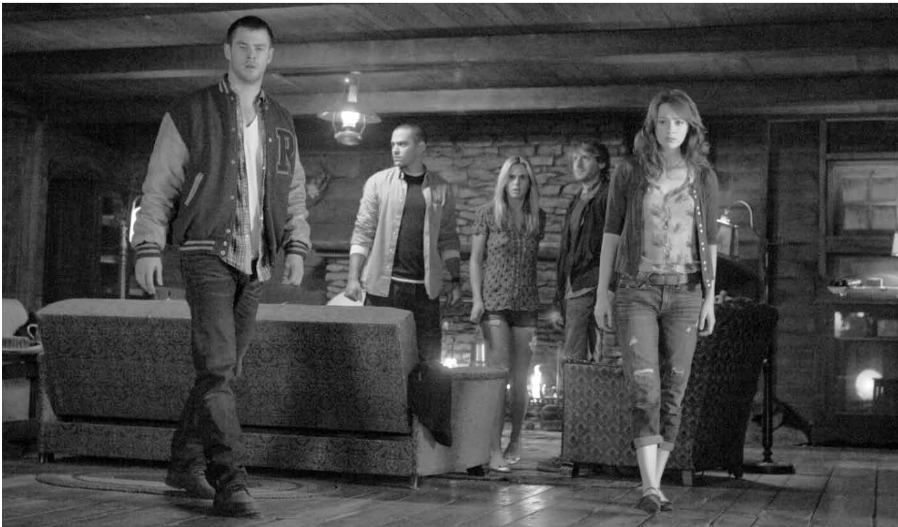
Teenager kurz vor der Begegnung mit Hinterwäldlerzombies... Und trotzdem ist „The Cabin in the Woods“ ein sehenswerter Film.