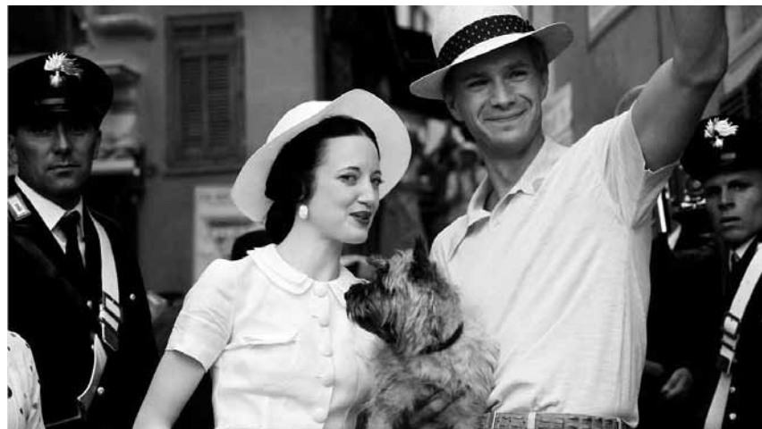
Madonna versucht wieder hinter der Kamera ihren Mann zu stehen, diesmal mit einer royalen Schnulze: „W.E.“, neu im Utopia.

Der jähzornige Joseph lässt sich oft in handgreifliche Streitereien verwickeln. Dabei ist er eigentlich ein ganz netter Typ mit viel Humor und einem ausgeprägten Gerechtigkeitsinn. Als er mal wieder einen besonders schlimmen Wutausbruch hat, trifft er auf Hannah. Die verheiratete Frau nimmt sich seiner an und schafft es langsam einen Zugang zu dem grobschlächtigen Arbeiter zu finden.