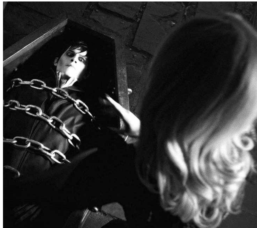
Nun macht auch noch Tim Burton auf Vampire: „Dark Shadows“, neu im Utopolis, CinéBelval, Kursaal und Starlight.

Netter doch belangloser Unterhaltungsfilm (...) farbenfroh ange-