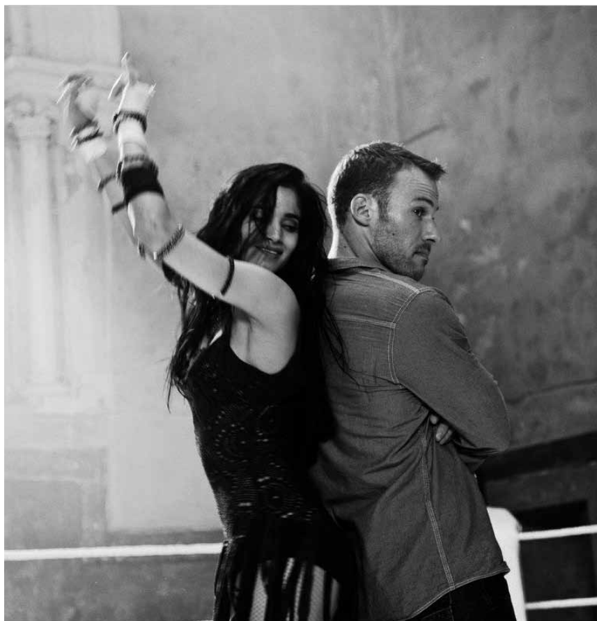
Tanzen bis der Arzt kommt oder wenigstens der Streetworker: „Street Dance 2“, neu im Utopolis und CinéBelval.

Quand Dan Geraldo, reporter en quête de scoop, arrive en Palombie, il ne se doute pas qu'il va faire la plus incroyable des découvertes. Avec Pablito, guide local plein de ressources, ils vont aller de surprise en surprise au cours d'une aventure trépidante et surtout révéler une nouvelle extraordinaire : le Marsupilami, animal mythique et facétieux, existe vraiment !