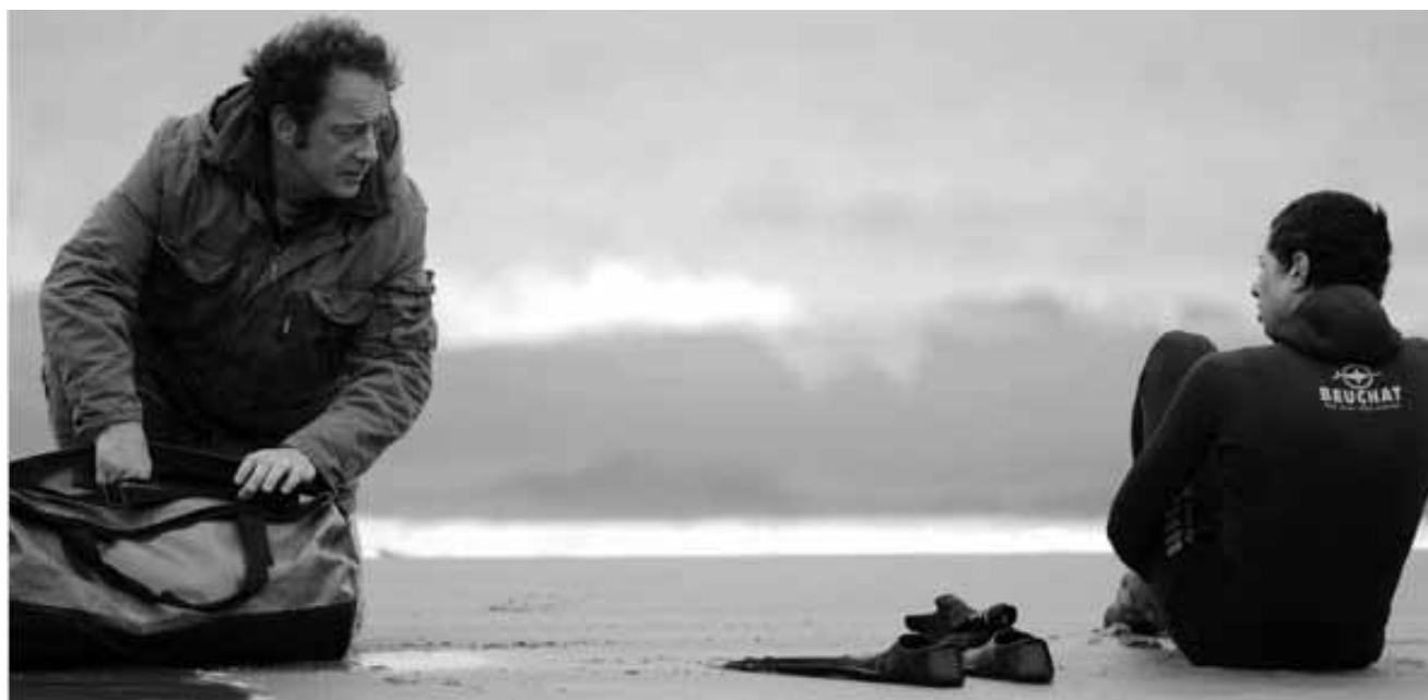
Vincent Lindon dans un de ses meilleurs rôles : « Welcome » raconte l'histoire d'un homme qui, par amour, affronte les lois de la jungle de Calais. Mardi à la Cinémathèque.

La reichste Mrs. Teasdale ist bereit, die Armut der Armen zu lindern, auf die Bedingung: dass Rufus T. Firefly zum Chef der Regierung ernannt wird. La Sylvania, mächtiger Nachbar, akzeptiert diese Ernennung zum schlechten Glück. Bald, scheint der Krieg unvermeidlich.