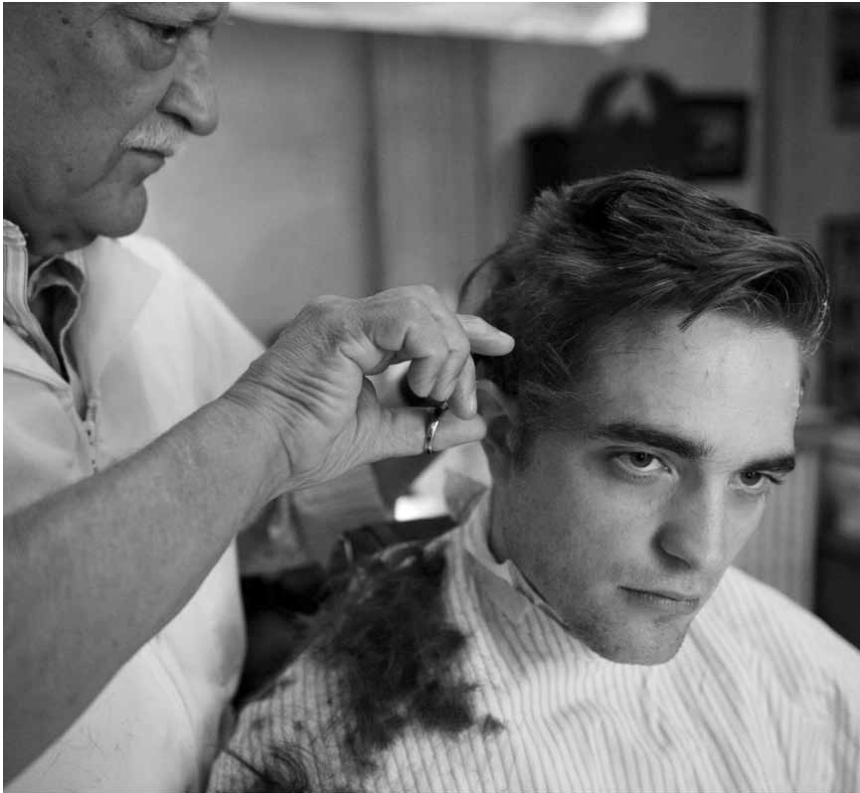
Ein Ex-Vampir will zum Friseur, doch das ist noch lange nicht alles. „Cosmopolis“, neu im Utopolis.