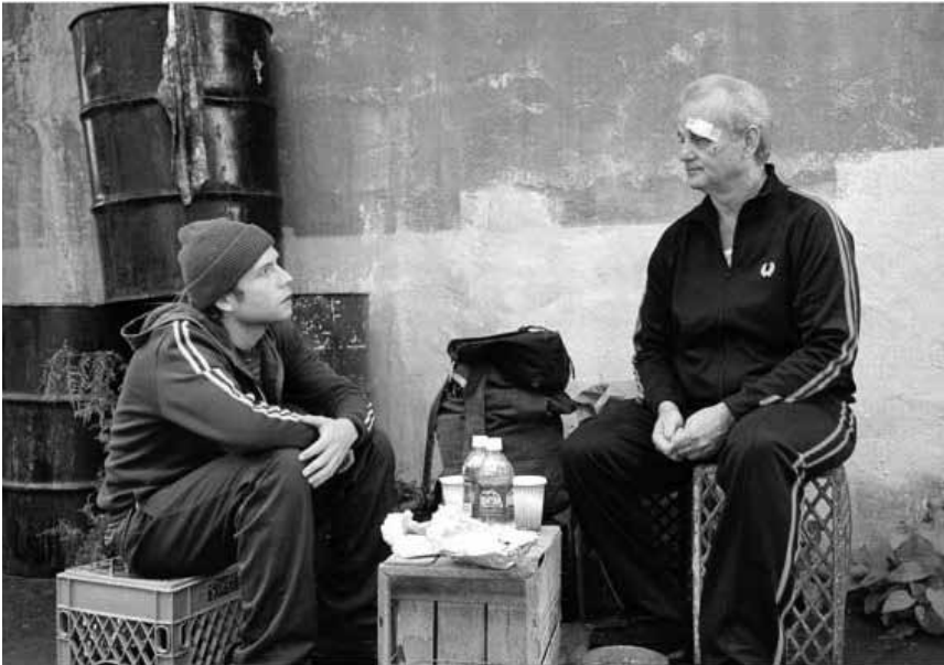
Auf der Suche nach dem verlorenen Sohn. Ein herrlich kaputter Bill Murray wandelt durch Jim Jarmuschs Universum in „Broken Flowers“, am Freitag in der Cinémathèque.