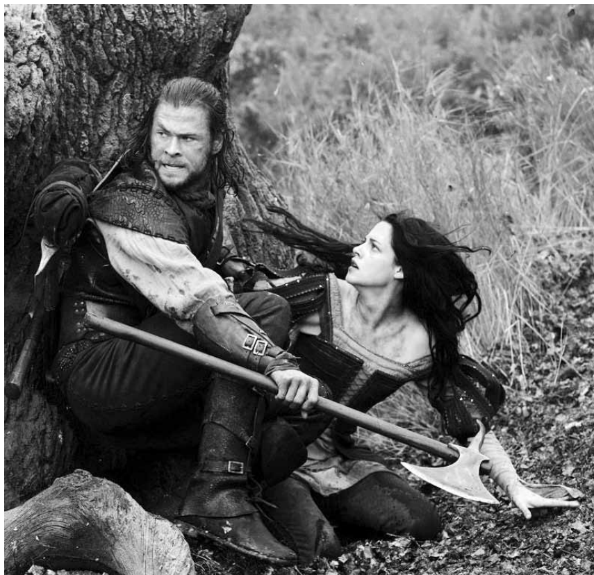
Grimms Märchenwelt wird wohl noch für so manchen Blockbuster geradestehen müssen: „Snow White and the Huntsman“, Vorpremiere am Mittwoch im Utopolis und CinéBelval.

Alors qu'elle rentre d'un voyage, Louise découvre que sa rue a été le théâtre d'un crime. Aucun témoin, tout le monde dormait. Paraît-il. Pierre, son mari, travaillait. Il était en mer. Paraît-il. La police enquête, la presse aussi. Jusqu'à cette nuit où Louise rêve. Elle rêve que Pierre lui parle dans son sommeil.