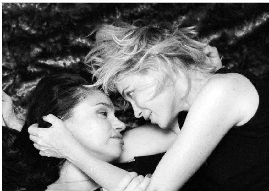
« Bye Bye Blondie », le nouveau film de Virginie Despentes explore la nostalgie des années 1980 et l'amour homosexuel. Cinéclub, jeudi à l'Ariston.

Welt vor Loki, dem Halbbruder des Donnergottes Thor, zu retten, der mit seiner Streitmacht die Erde unterwerfen will. Doch die Helden sind es nicht gewohnt im Team zu arbeiten.