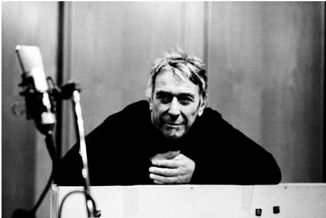
Toujours pas fatigué : John Cale.