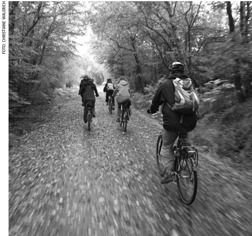
Im Wald fährt es sich gemütlich. Doch die Städte gehören den Autos. Damit das anders wird: Fahrrad-Demo „Critical-Mass“ am Freitag, 26. Oktober ab 18 Uhr am Hauptbahnhof.