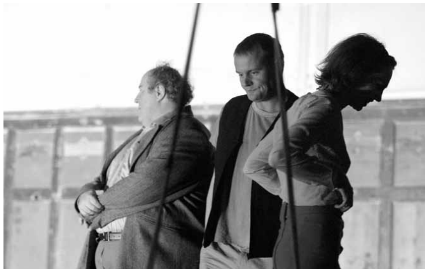
Große russische Klassik kann man am 19. und am 20. Oktober im Grand Théâtre genießen, mit Anton Tschekows „Onkel Wanja“.

Rhythm & Swing BigBand , Tufa, Großer Saal, Trier (D) , 20h. Tél. 0049 651 7 18 24 12.