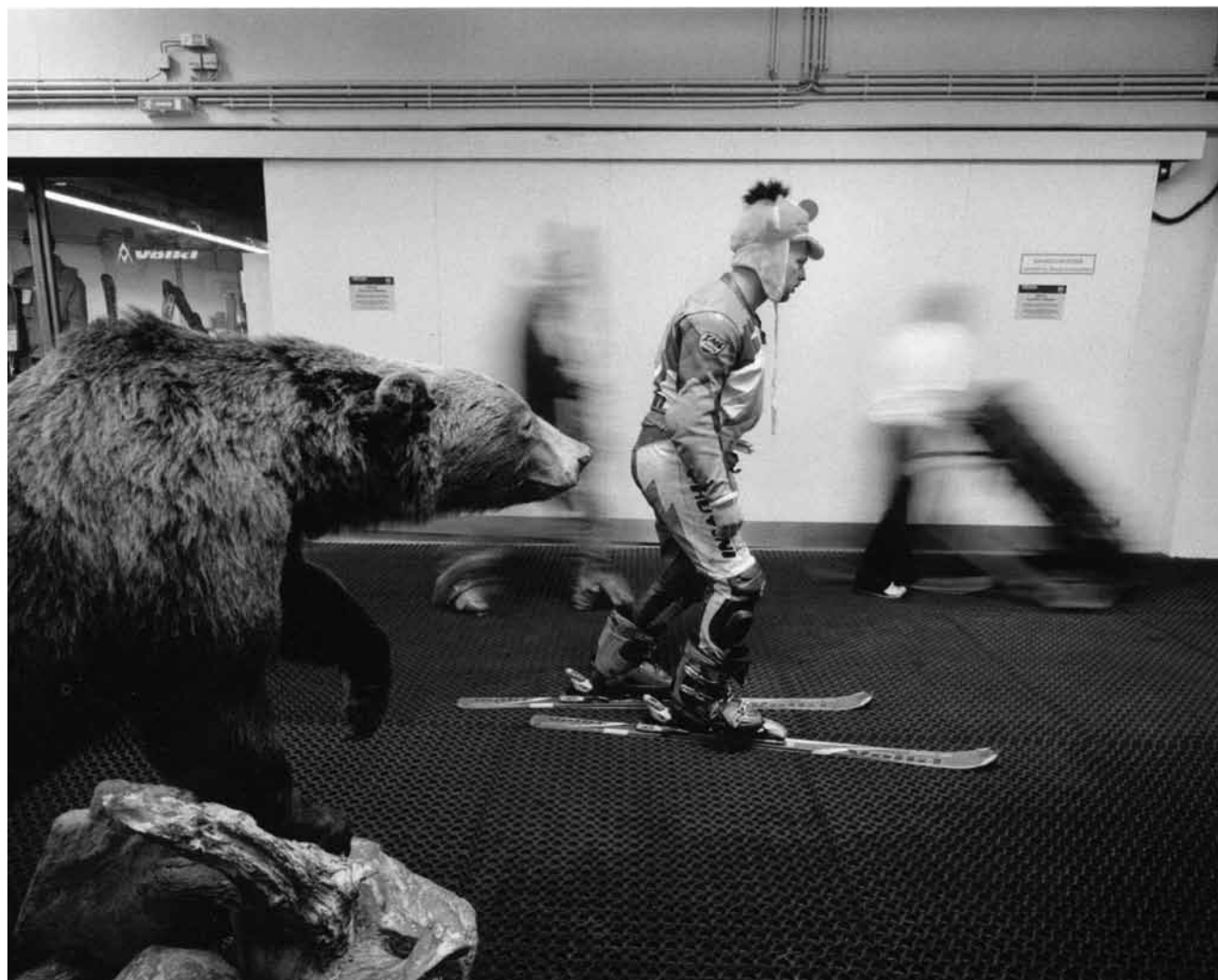
Wer braucht denn schon richtige Ferien? Dieser Frage geht der österreichische Fotograf Reiner Riedler mit seinem Projekt „Fake Holidays“ auf den Grund. Bis zum 30. September 2013 auf dem Marktplatz in Clervaux.

„Wie fundiert Andersons Arbeiten sind, wie sehr er sich auch mit Schriftstellern und Künstlern anderer Epochen oder philosophischen Themen auseinandersetzt, kann die